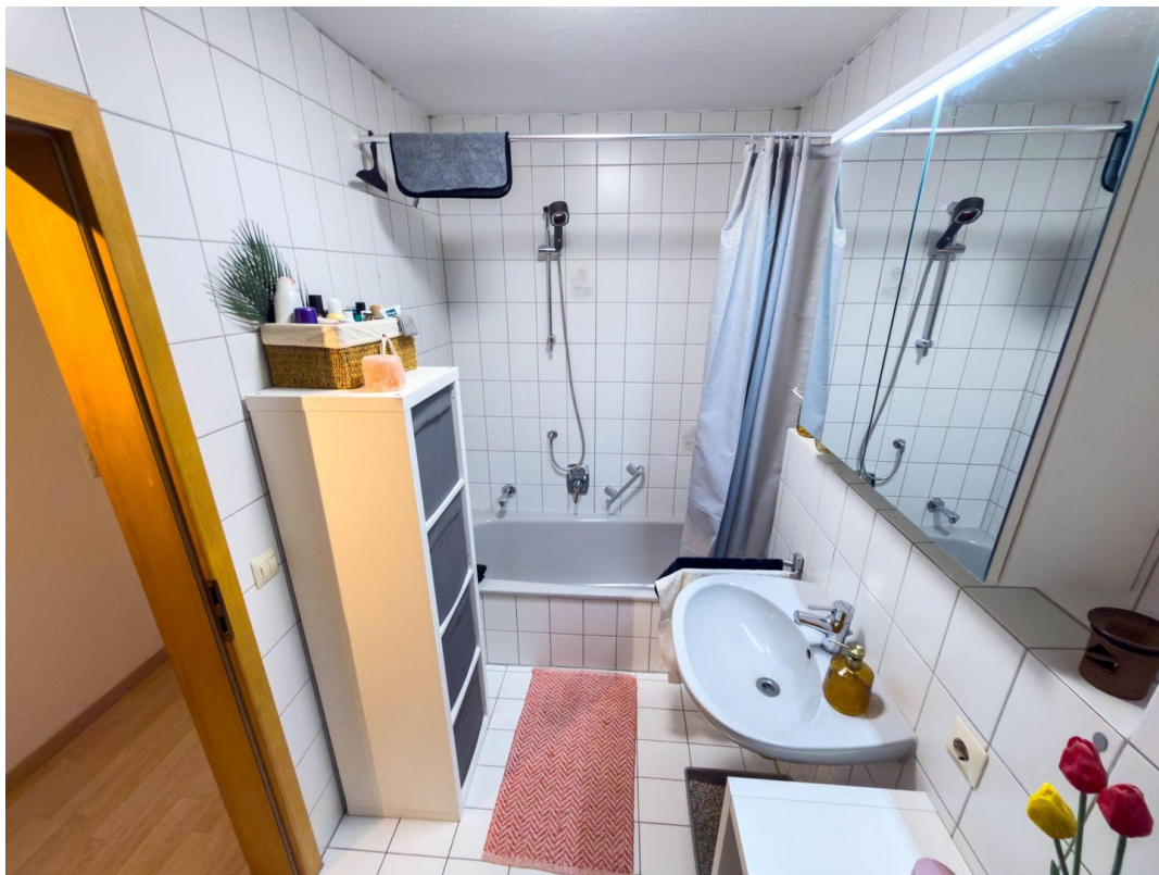
Bad Bild 2