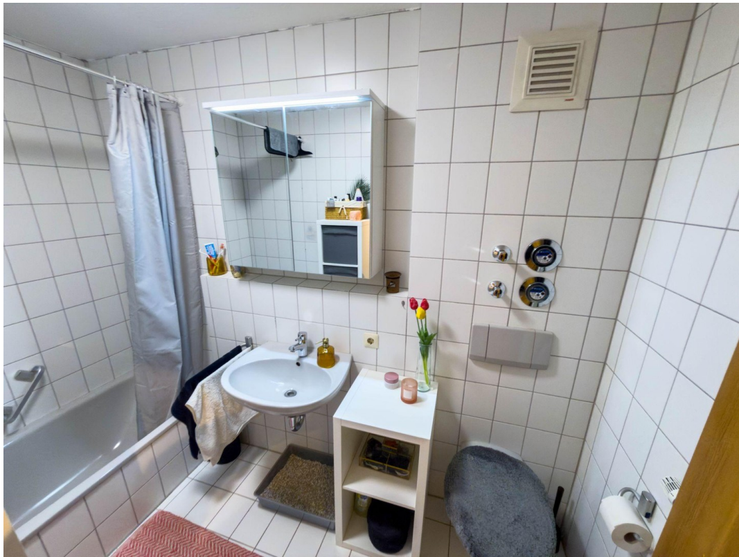
Bad Bild 1