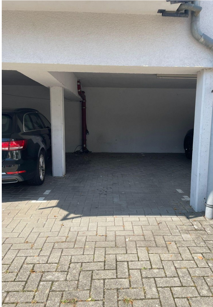
Überdachter PKW Stellplatz