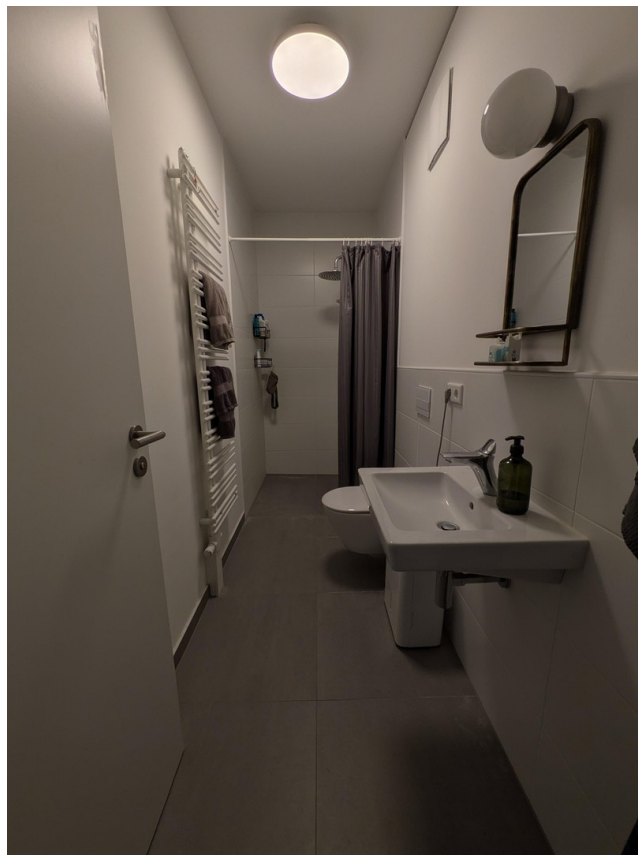
WC mit Dusche