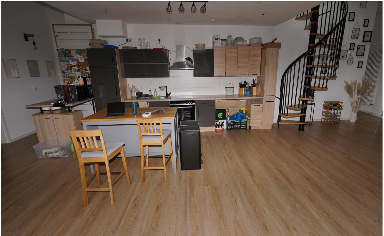
Küche, Wendeltr Dachterrasse