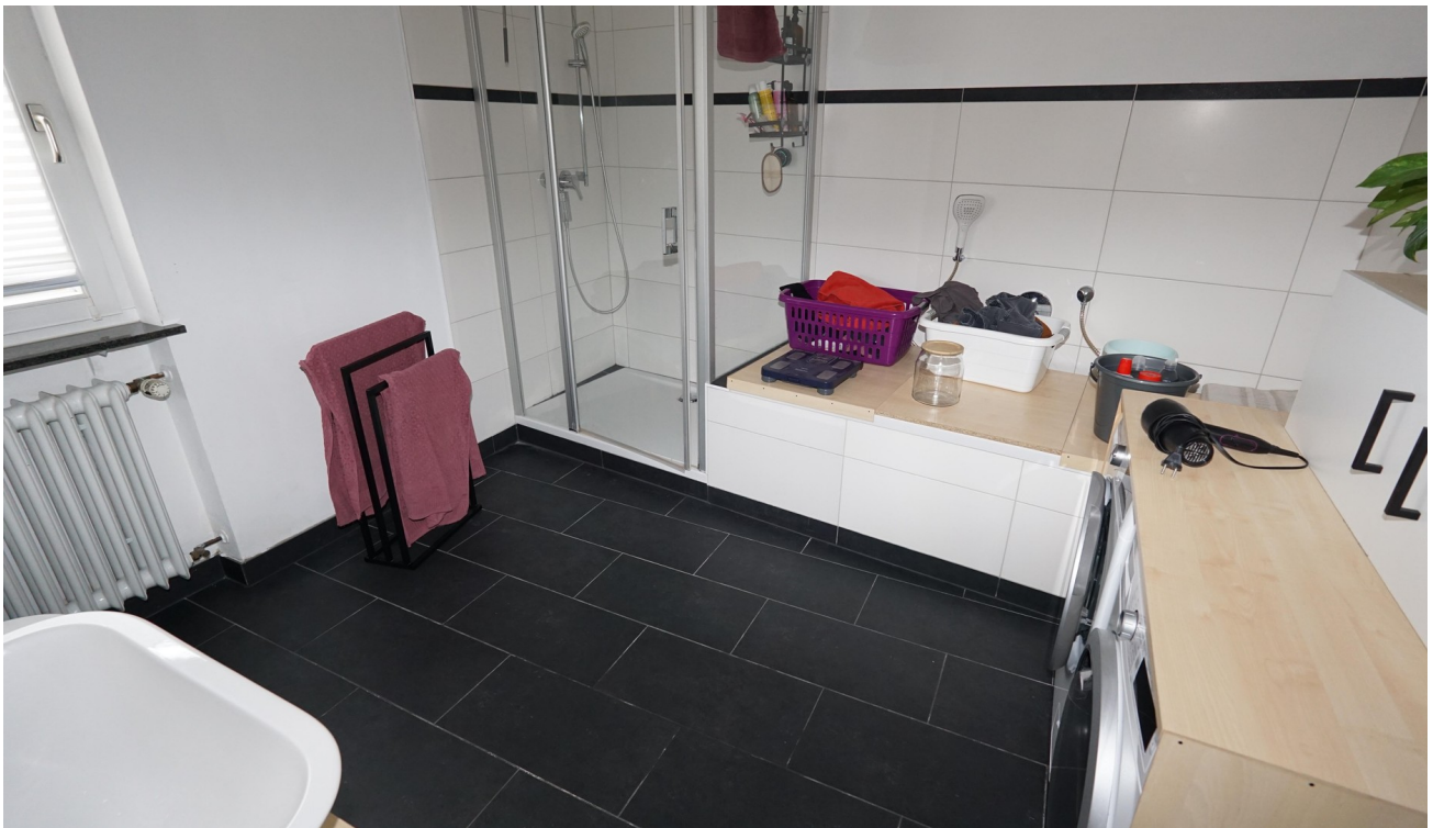
Bad mit Dusche und Wanne