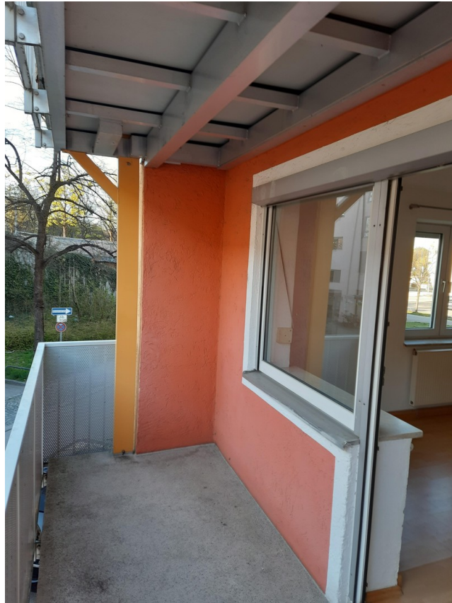
Balkon vor Wohnzimmer