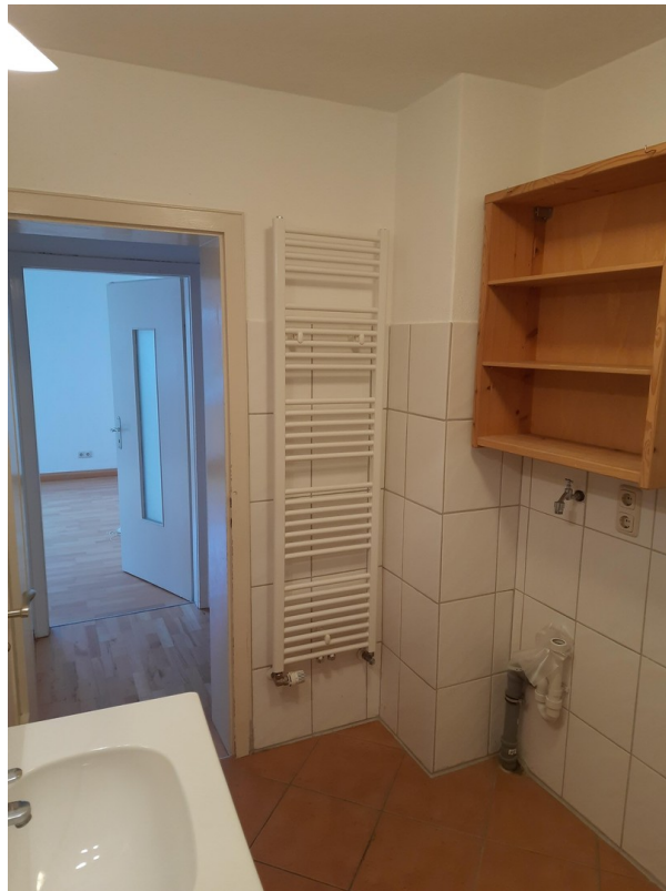
Bad mit Heizkörper