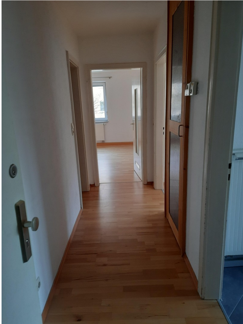
von Haustüre in Flur