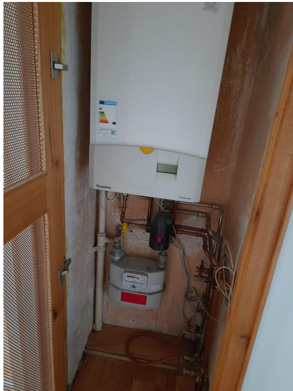
Gastherme im Flur