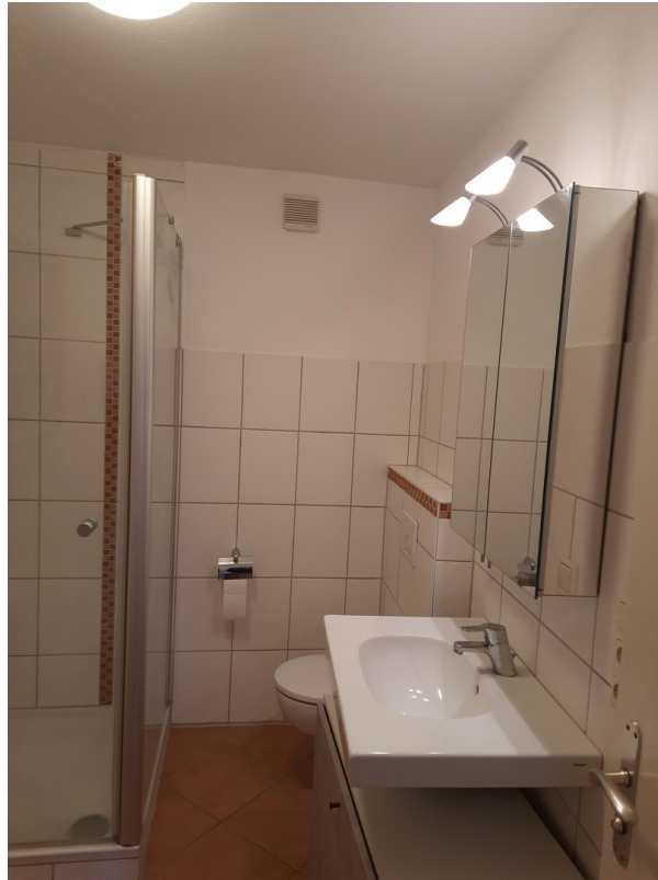
Bad mit Waschbecken Toilette