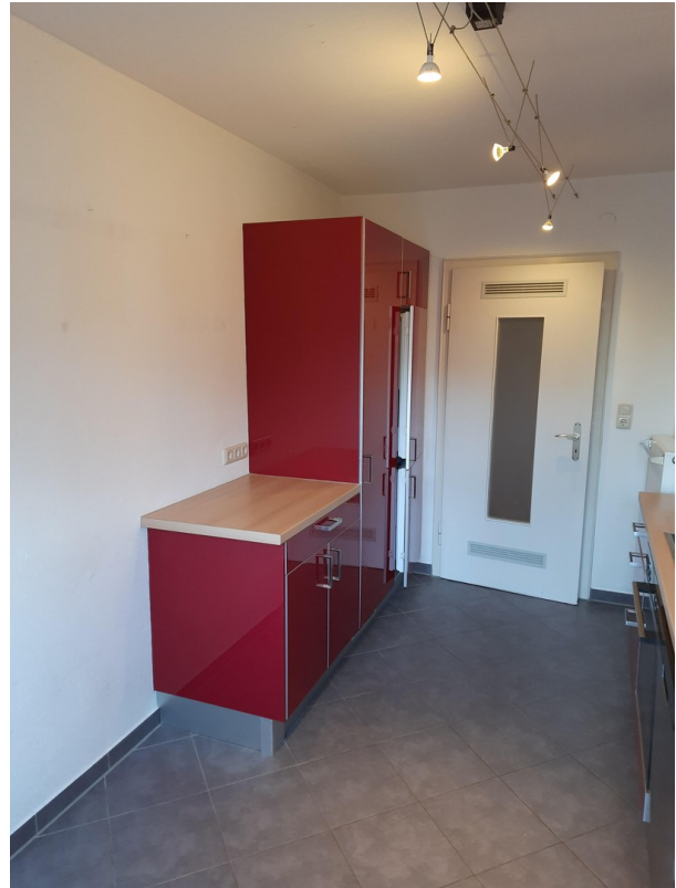
Küche rechts mit Essplatz