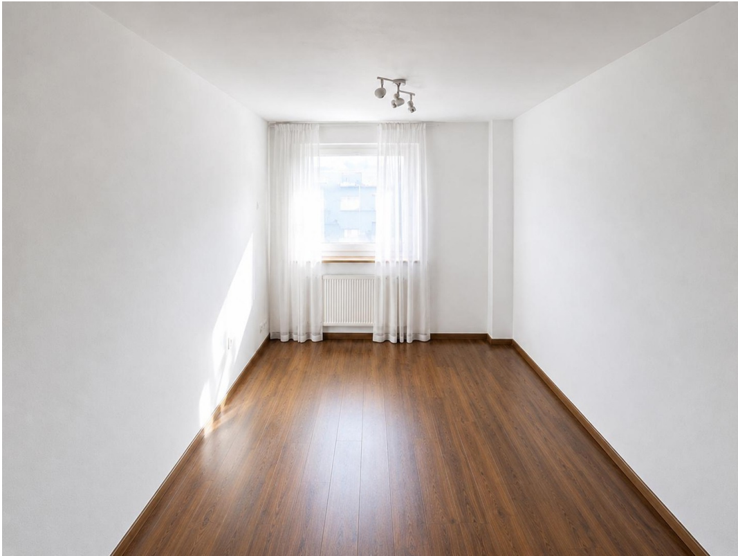
Kinderzimmer / Arbeitszimmer