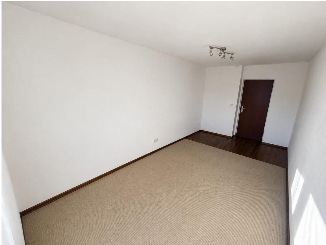
Kinderzimmer / Arbeitszimmer