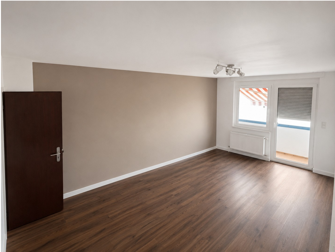
Wohnzimmer mit Westbalkon