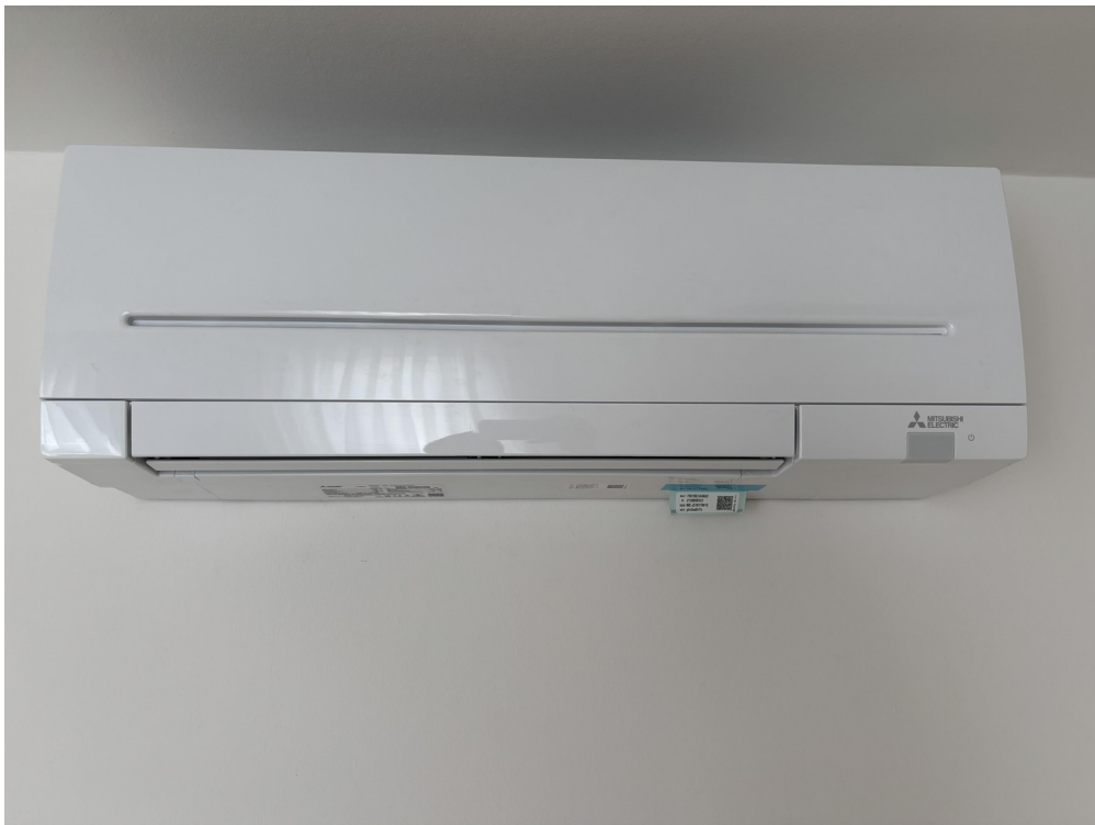
Räume sind klimatisiert