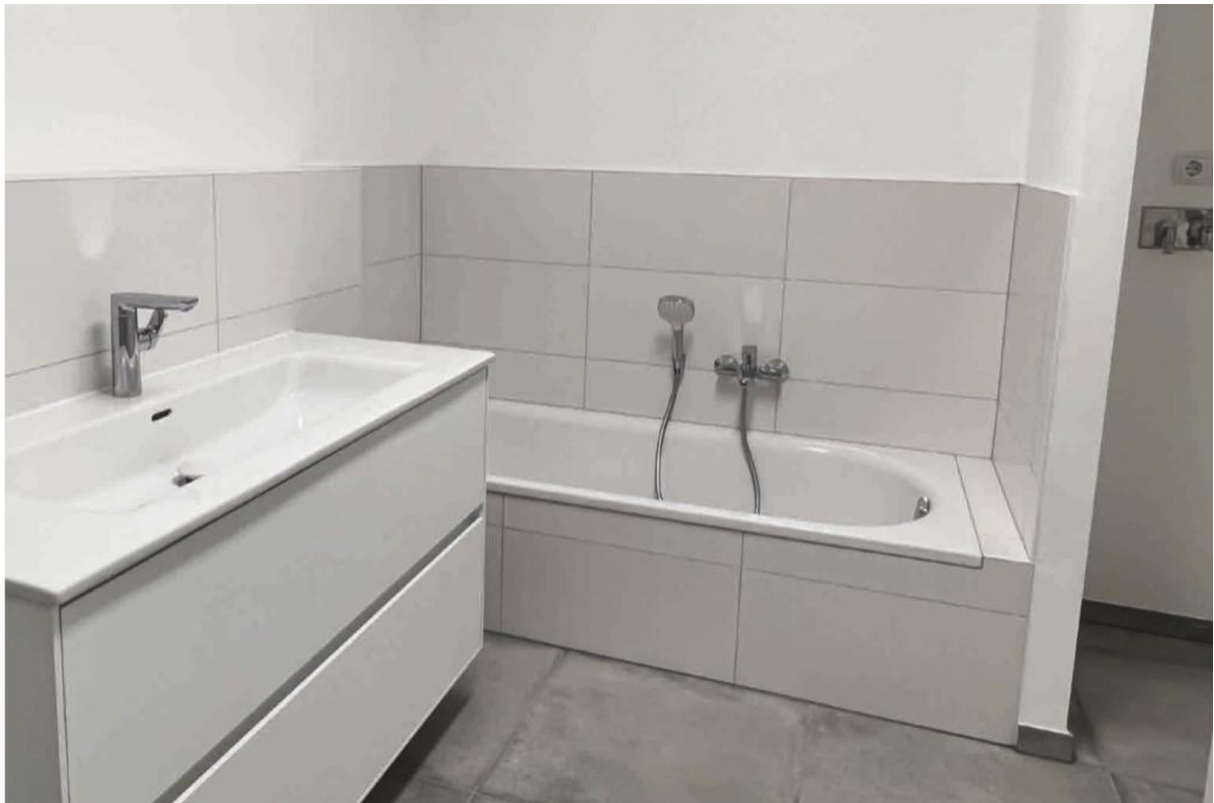
Badewanne und WM Anschluss