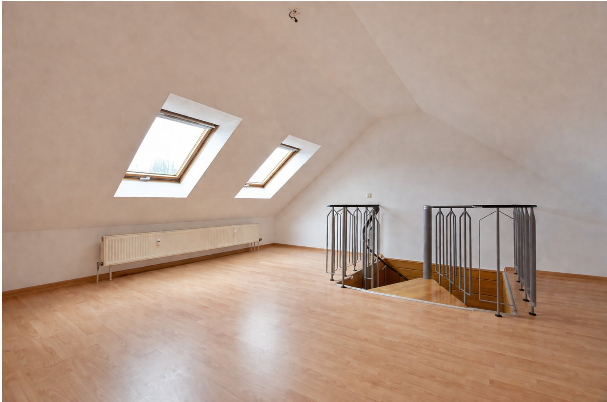
Oberes Stockwerk 1