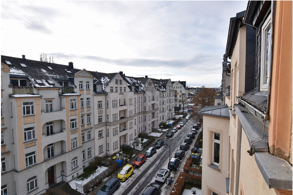
Ausblick auf den Kaßberg