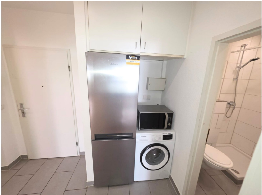
Kühl Gefrierkombi, Waschmaschi