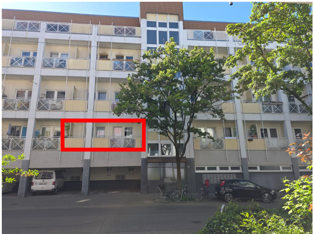
2 Zimmer Wohnung