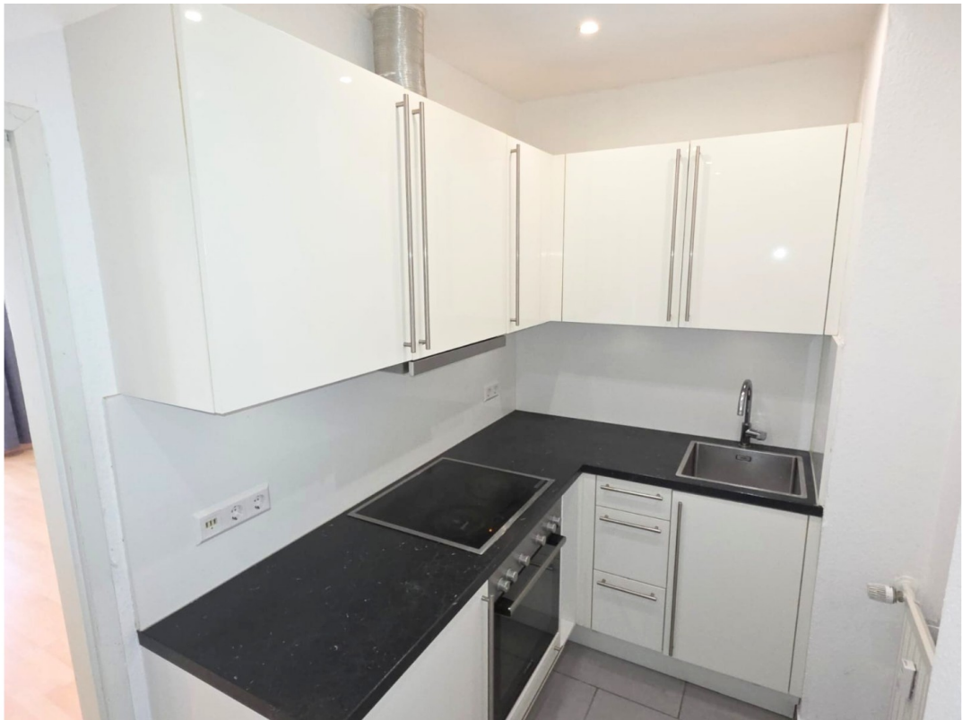
Küche mit Abluft