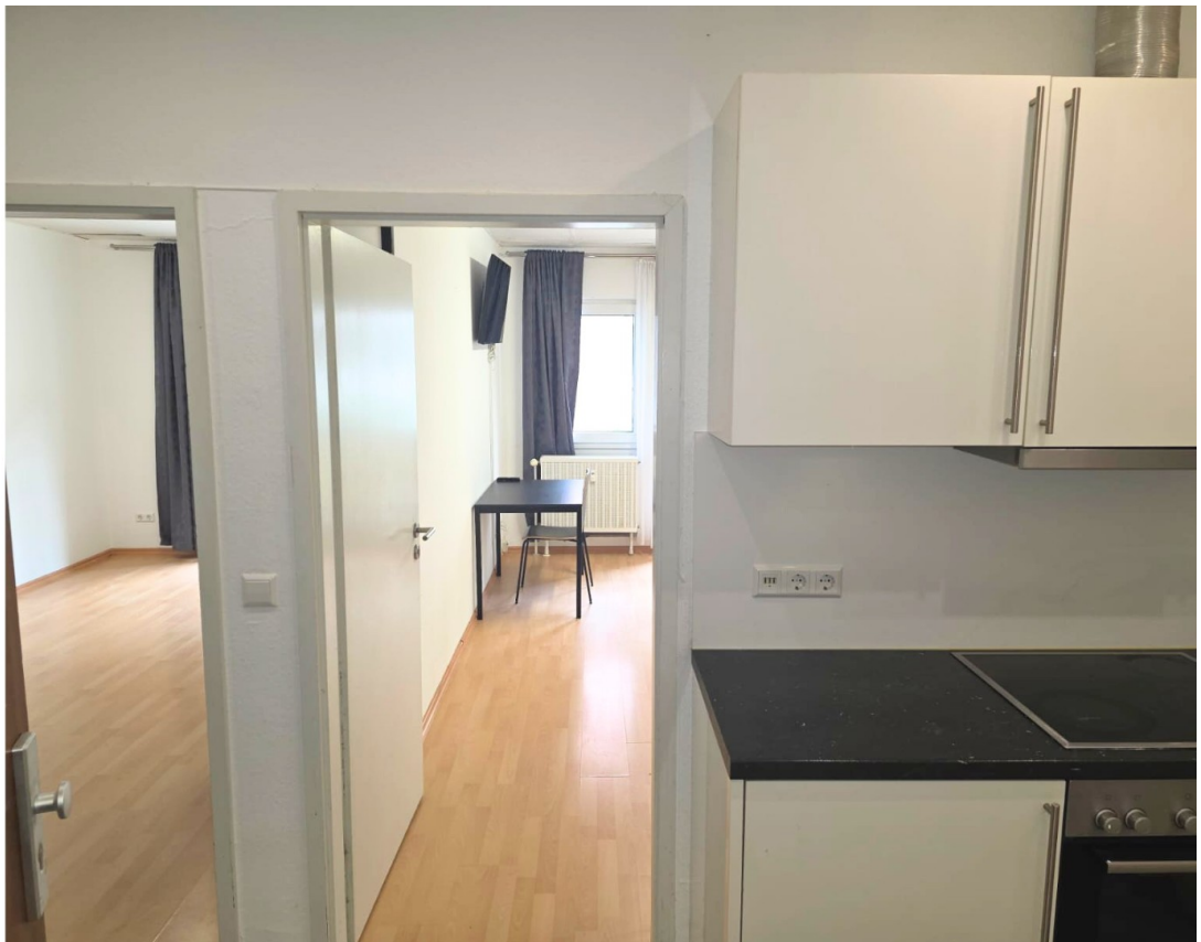
Flur mit Küche