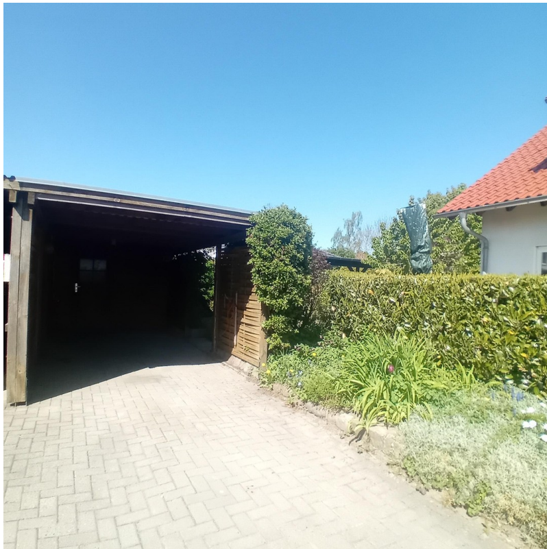
Carport und Stellplätze