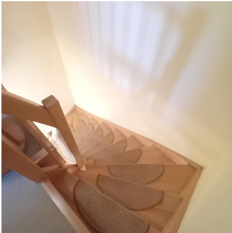
Treppe ins OG