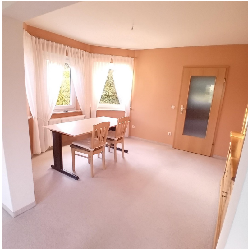
Esszimmer mit Zugang zur Küche