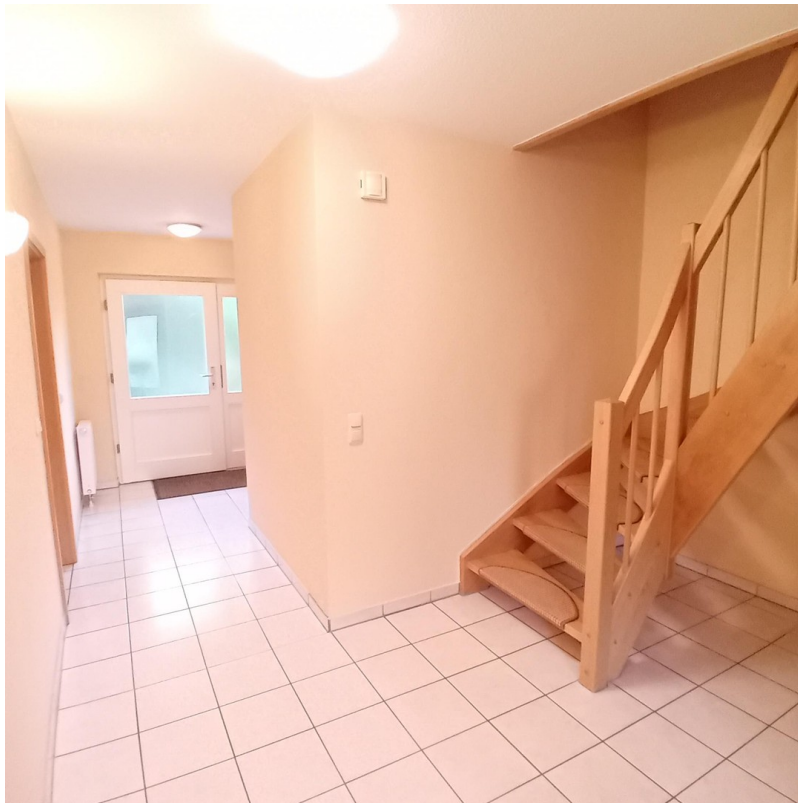
Diele EG mit Treppenaufgang