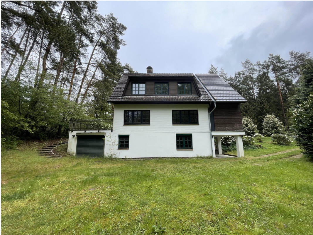
Außenansicht mit Garage