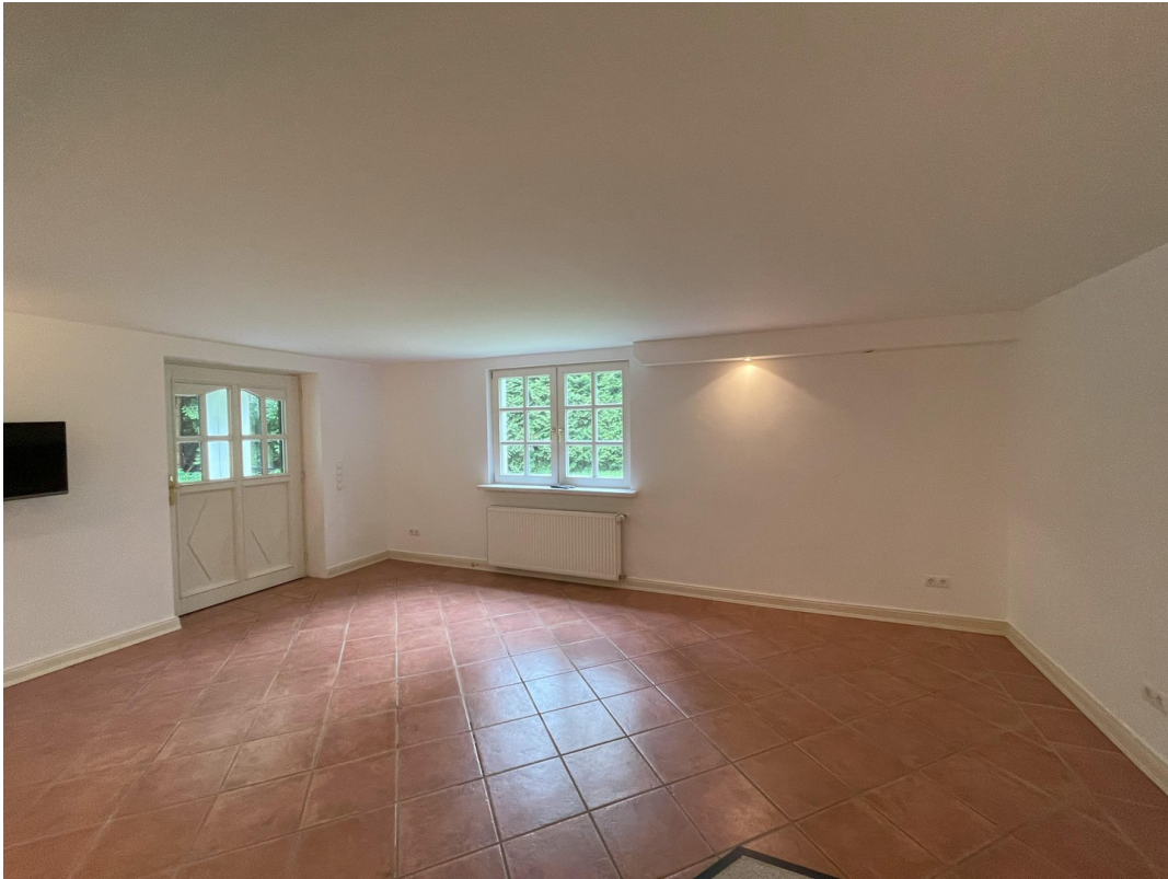
Wohnlicher Raum im Souterrain