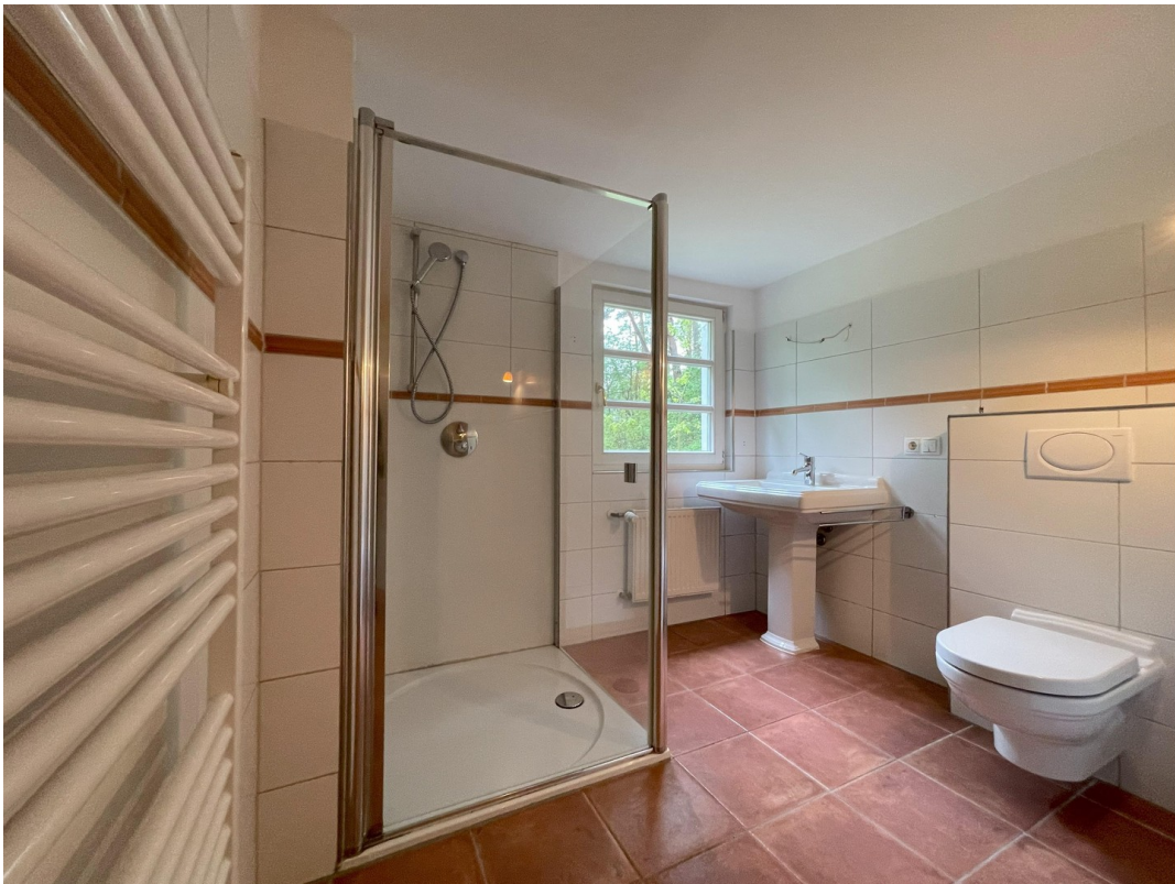
Modernes Duschbad - Souterrain