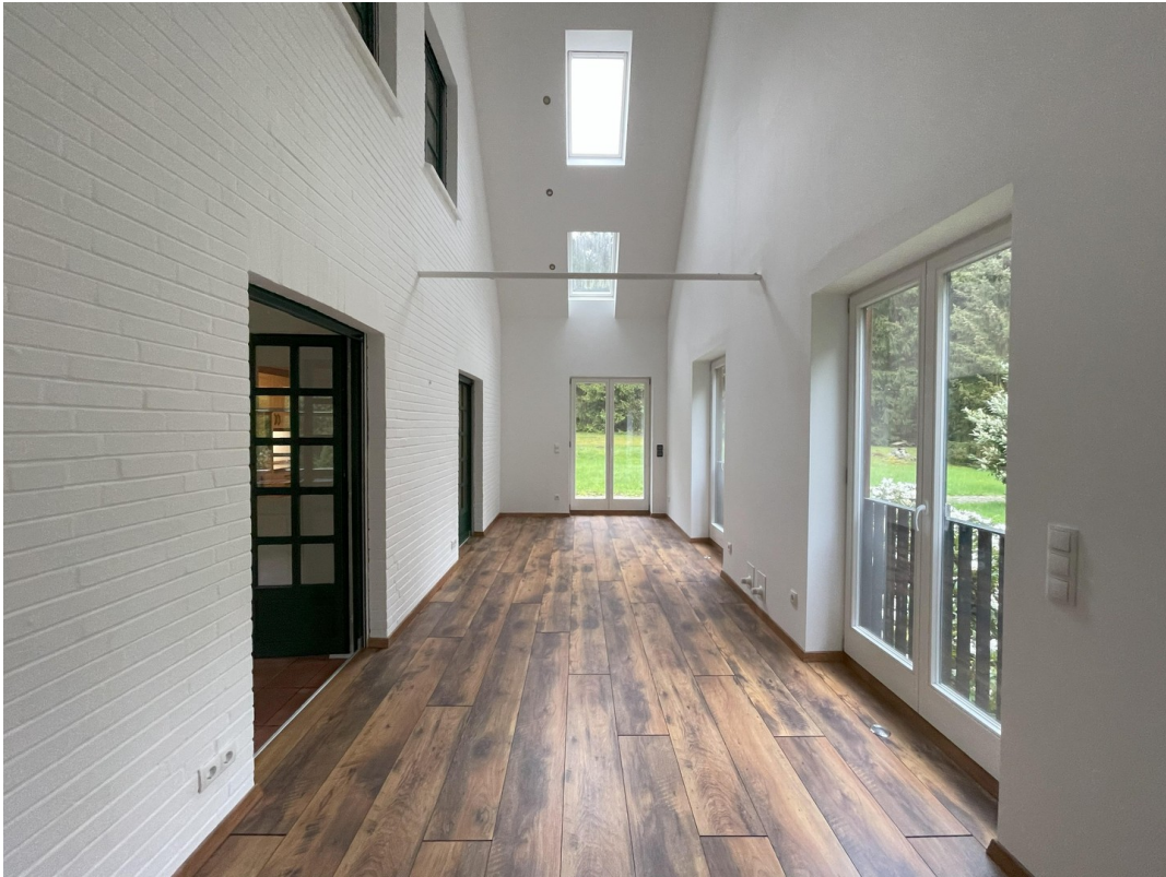
Anbau für mehr Optionen