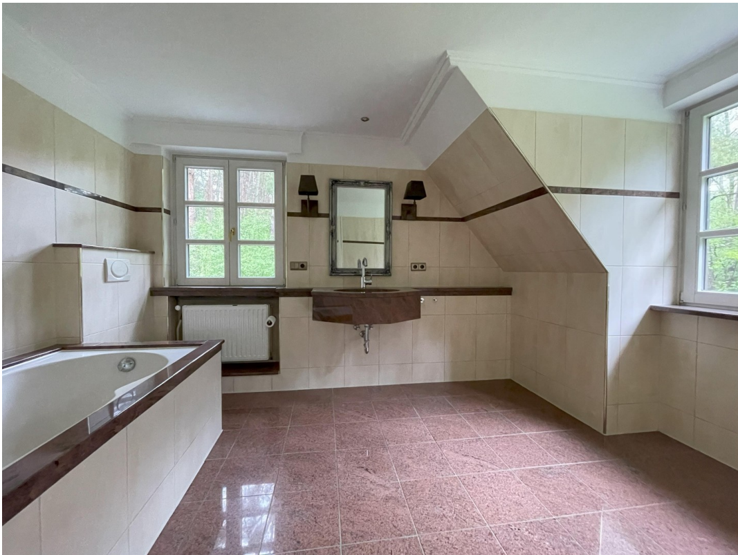
Modernes Vollbad im DG