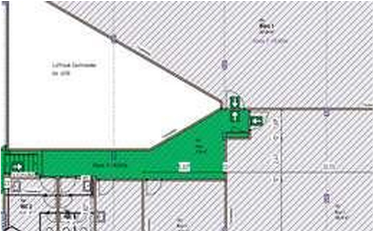
Grundriss 2 OG Büroetage