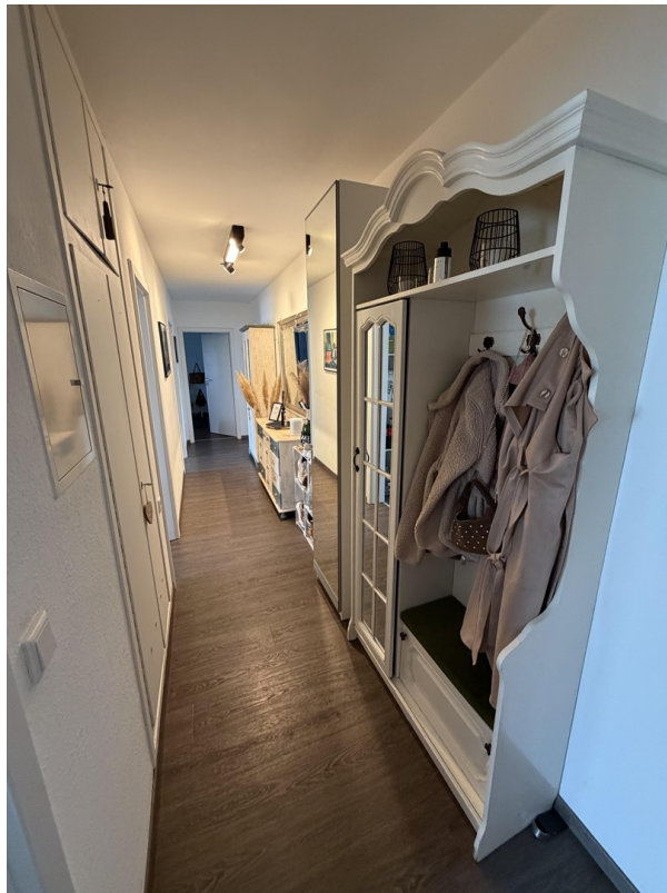
Flur - ausgehend vom Eingang