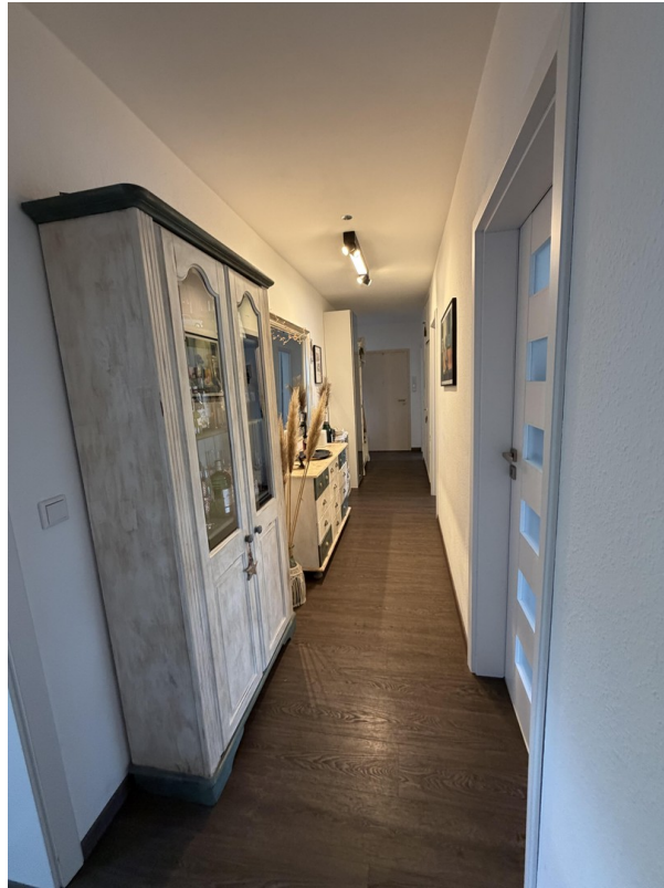
Flur - ausgehend Schlafzimmer