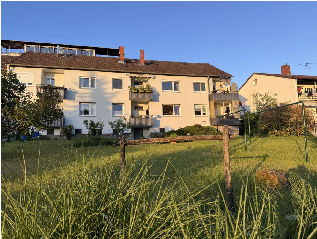
Hausansicht - Gartenseite