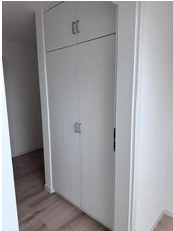
Einbauschranks im Flur