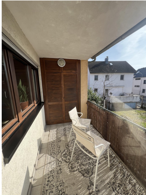
Balkon mit Einbauschränk