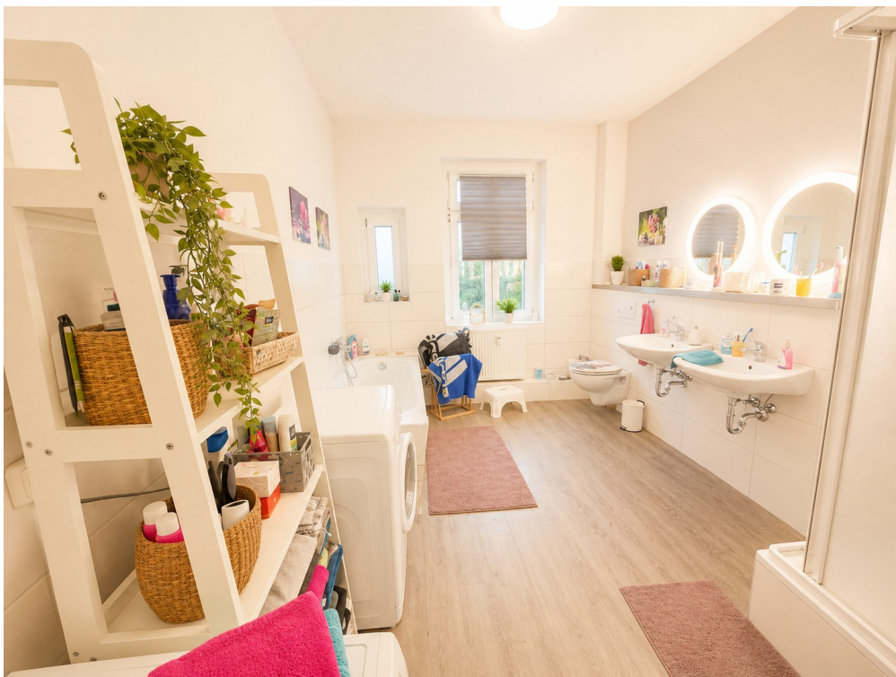
viel Platz mit Badewanne