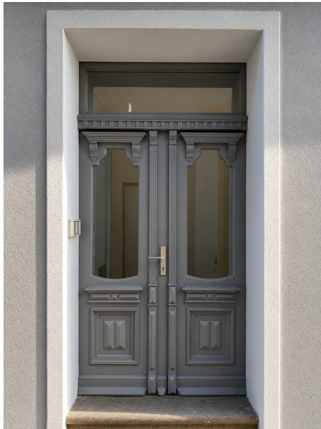
Willkommen im schönen Altbau!