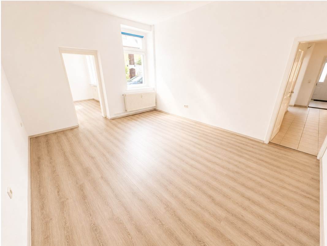
hohe helle Räume