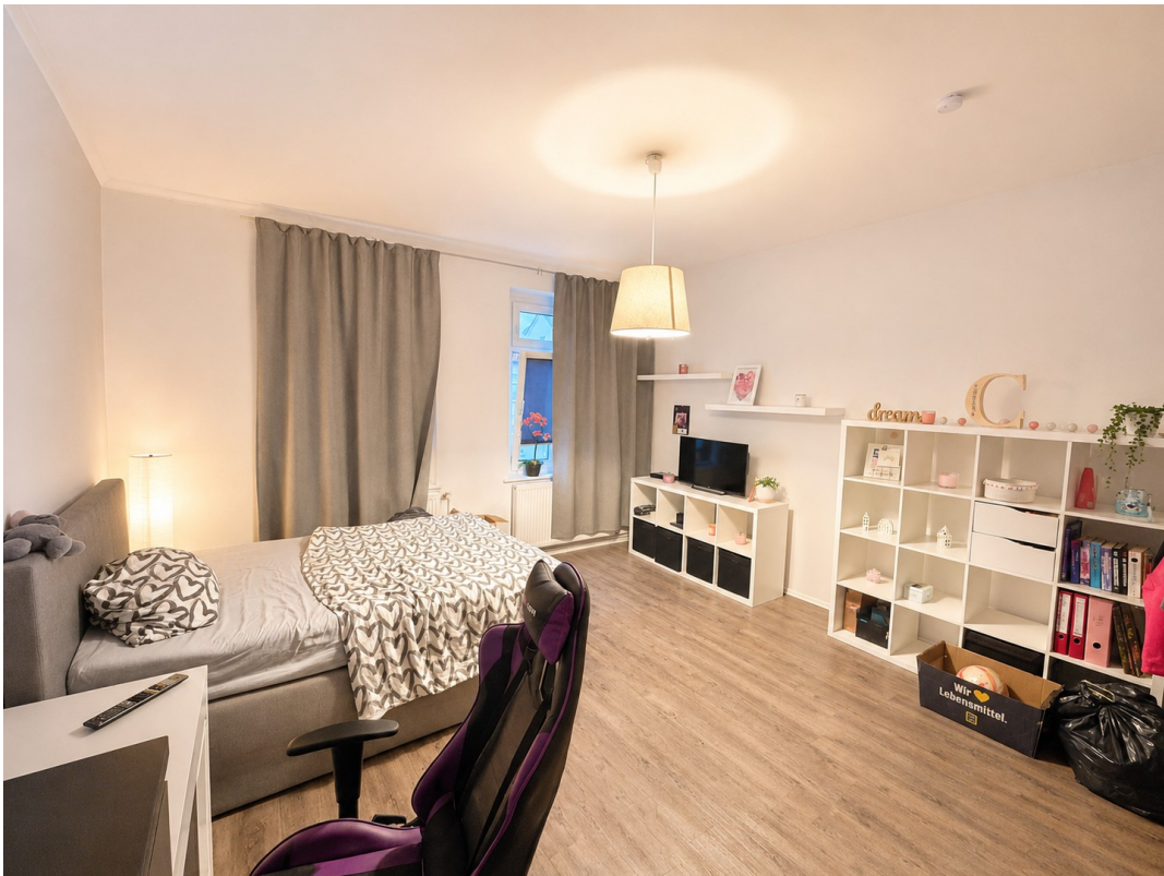
Schlafzimmer mit viel Platz