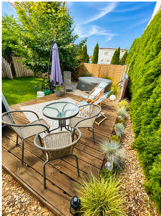
Auszeit im Grünen!