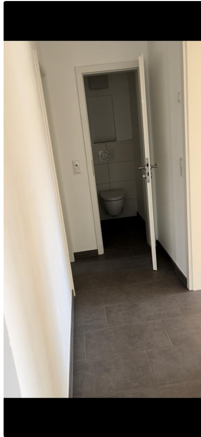
Flur und Gäste-WC