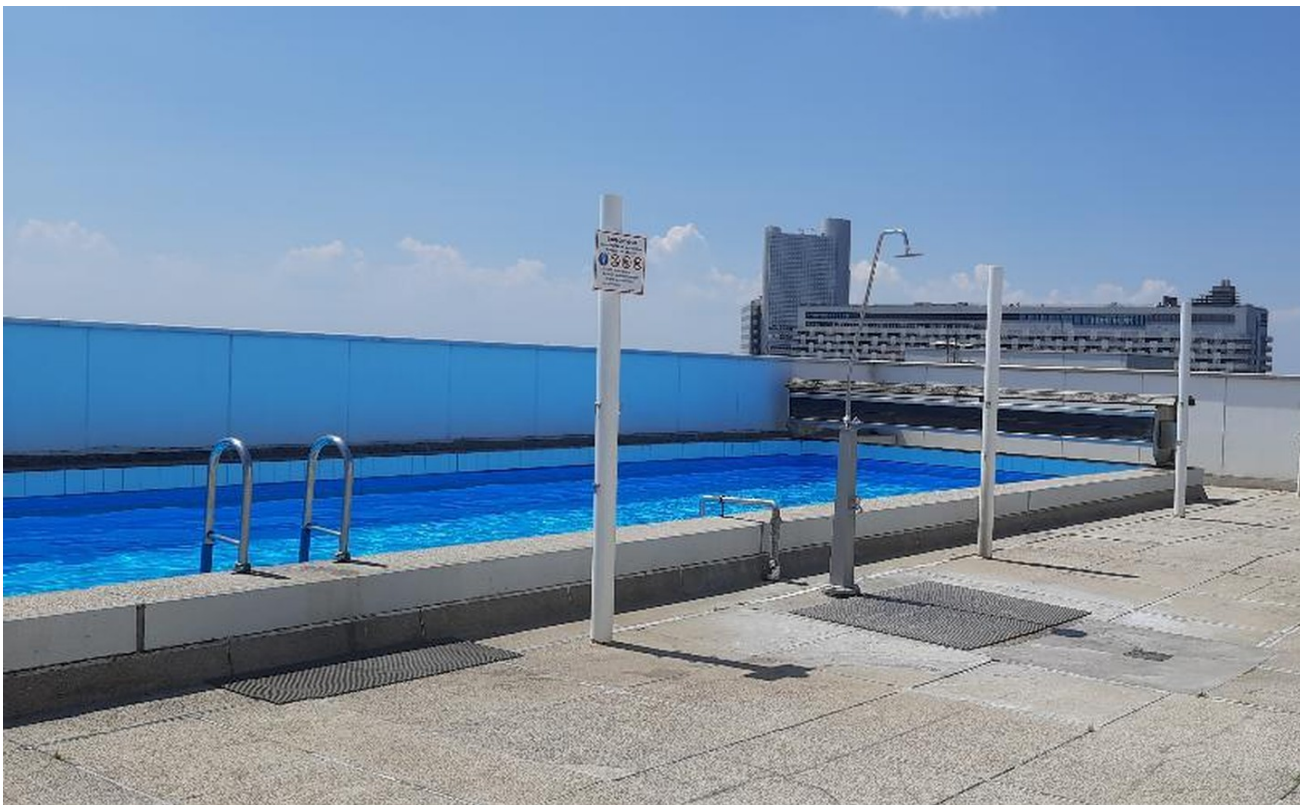
Schwimmbad mit Sonnenterrasse