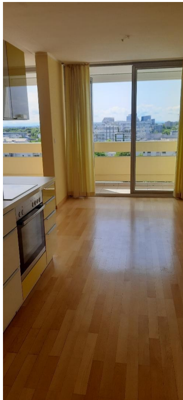
Einbauküche mit Durchgängen