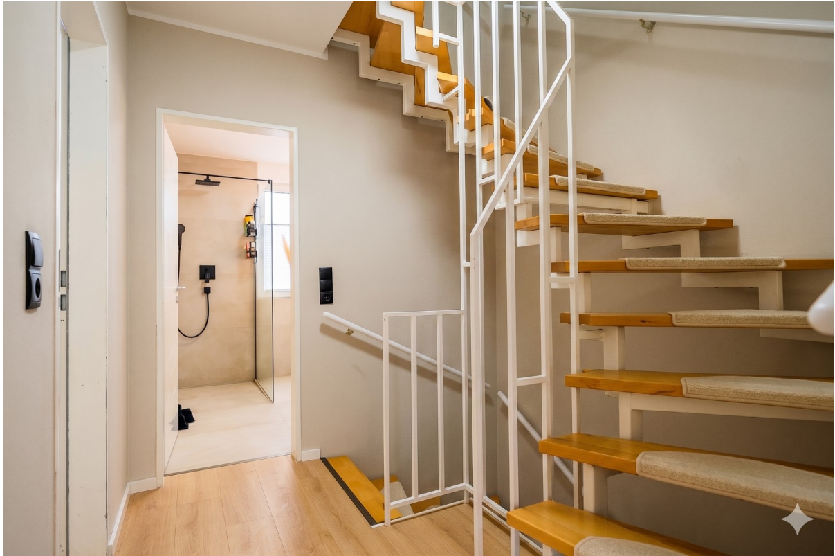
1. OG Flur