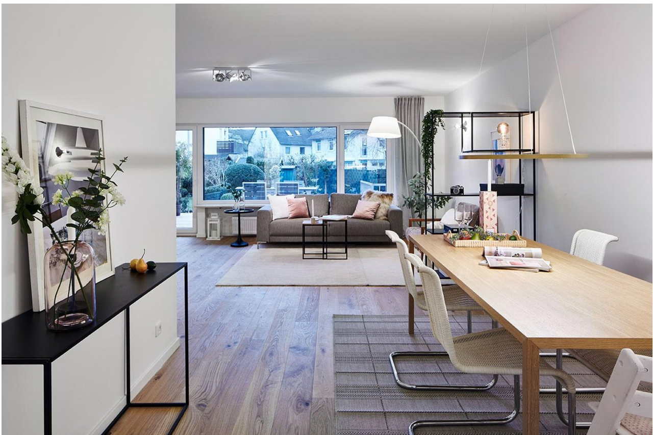
Offener Wohnbereich II