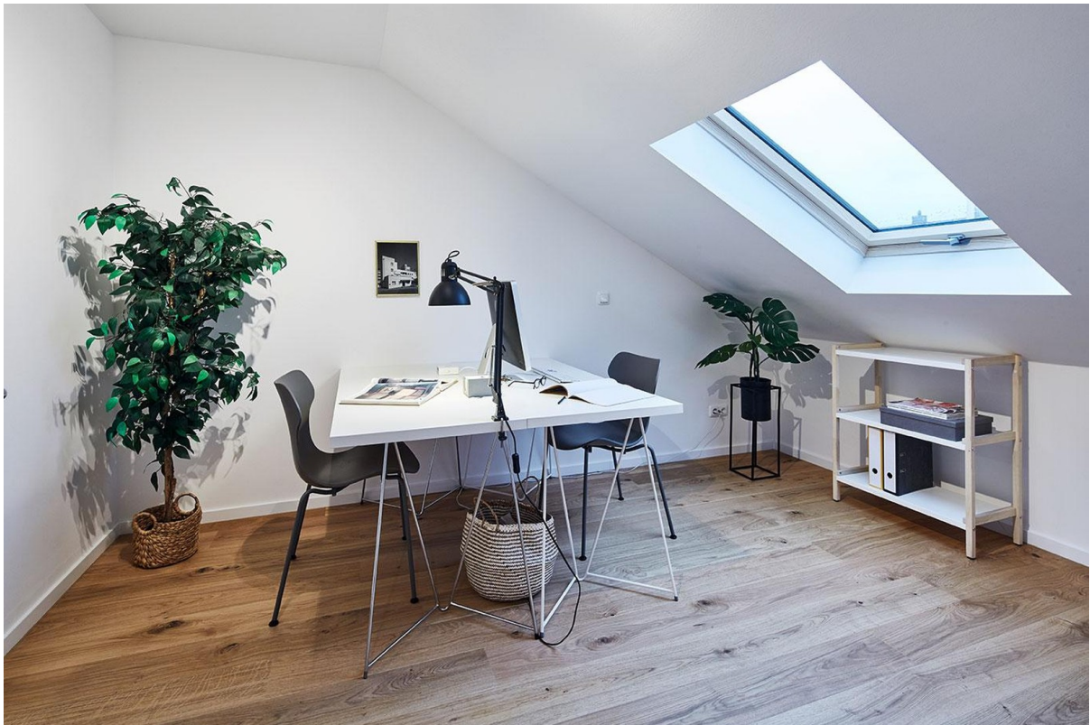
Helles Zimmer I Dachgeschoss