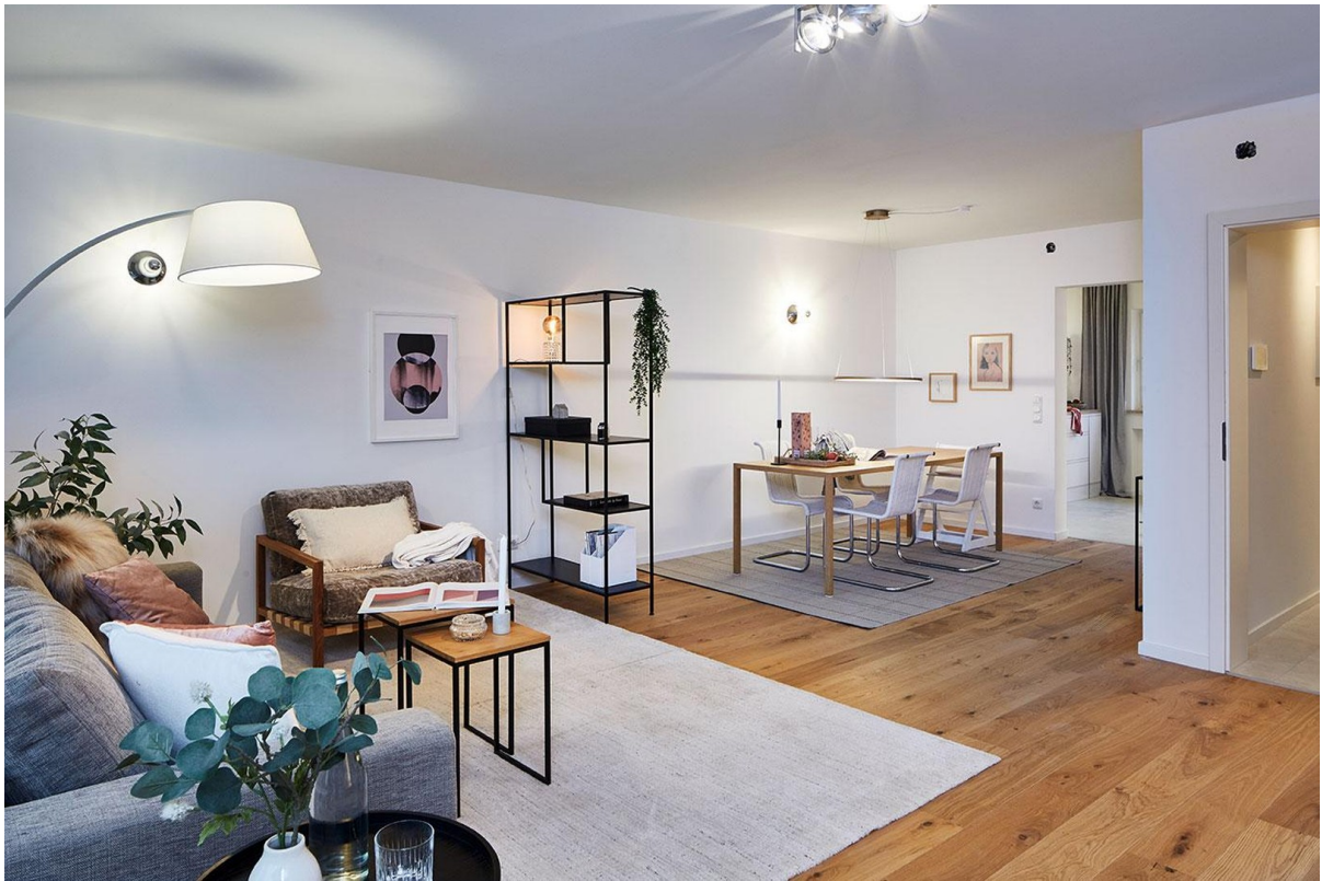
Offener Wohnbereich III