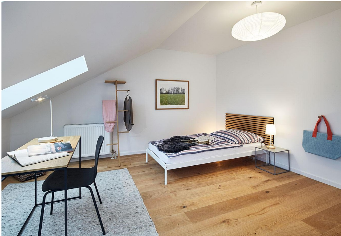
Helles Zimmer II Dachgeschoss