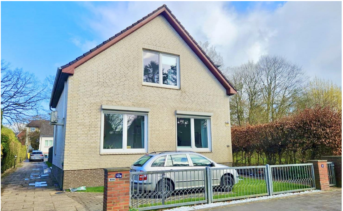
Vorderansicht mit PKW-Platz