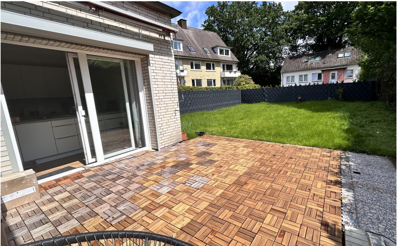
Blick Garten aktuell