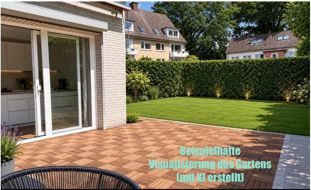
Blick Garten Visualisierung KI