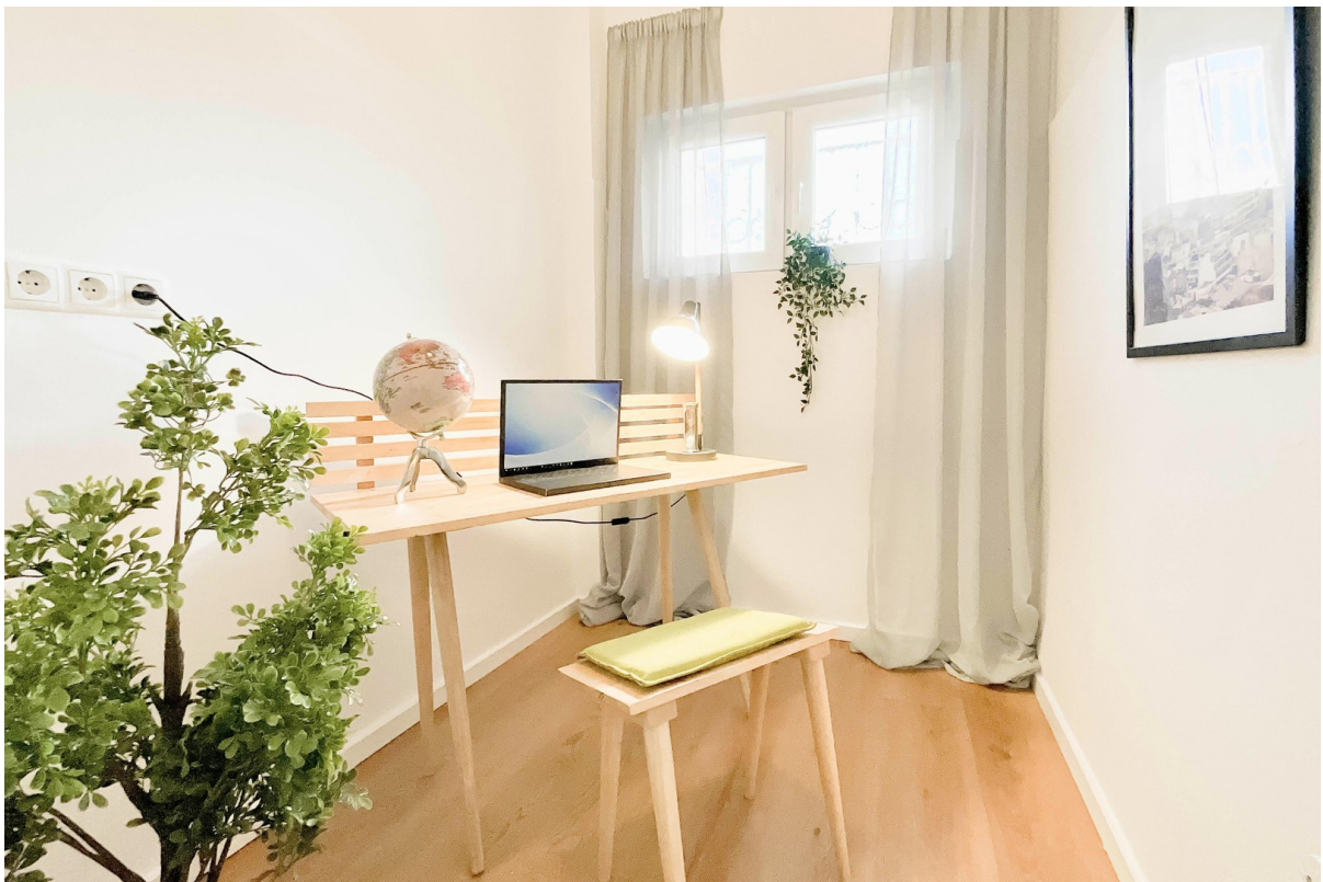
Halbes Zimmer EG