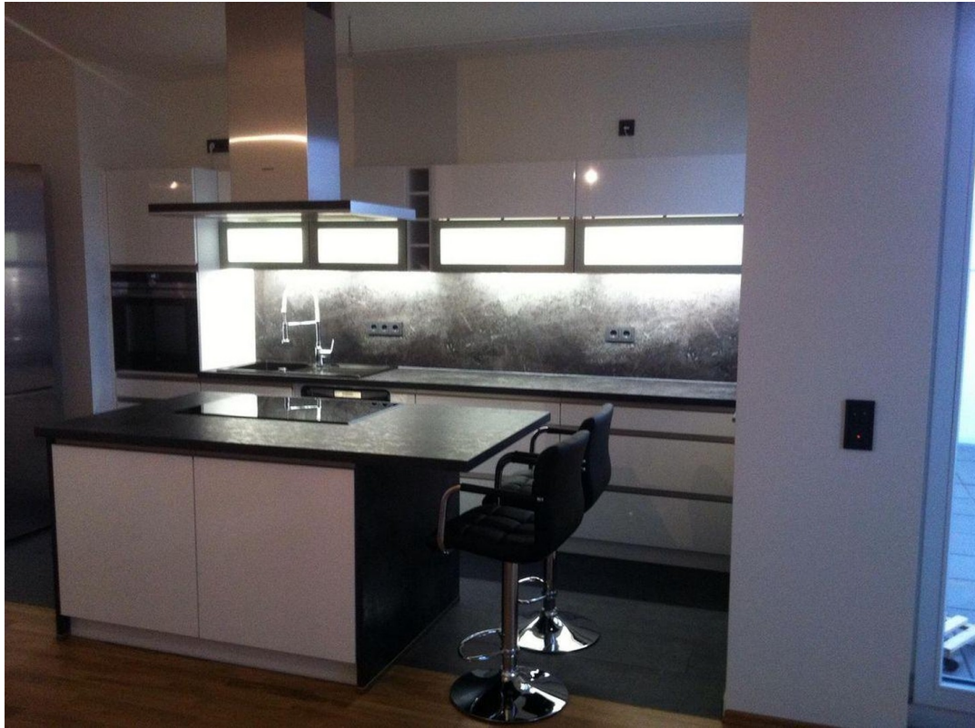
Hochglanz Weiß Küche