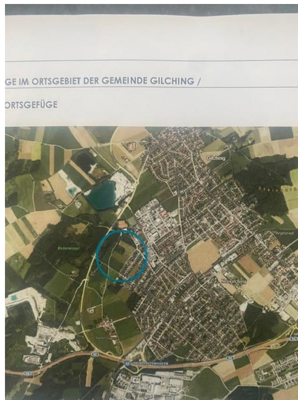
Lage in Gilching