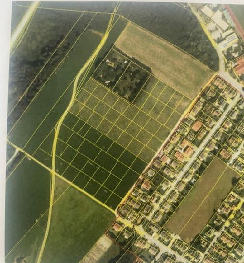
Lage am Grübl

Bodenrichtwert wird gemäß § 196 BauGB und §§ 14–16 Immo- chterausschuss ermittelt. Er stellt den durchschnittlichen Lag- richtwertzone dar und bezieht sich auf ein fiktives, typische d.