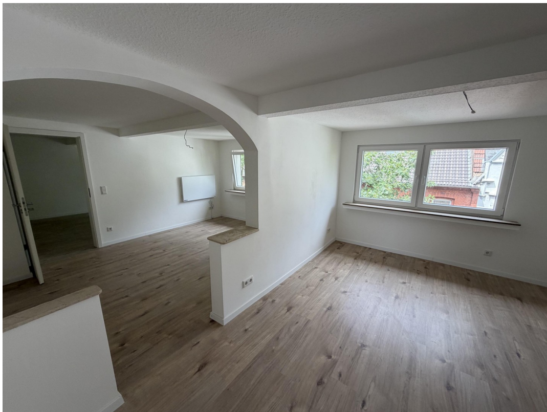
Wohn- / Essbereich