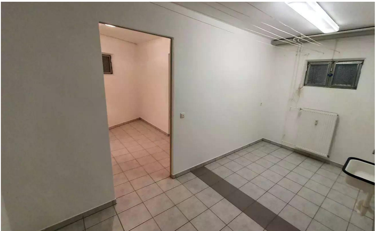
Raum 1 u. 2 KG (optional)