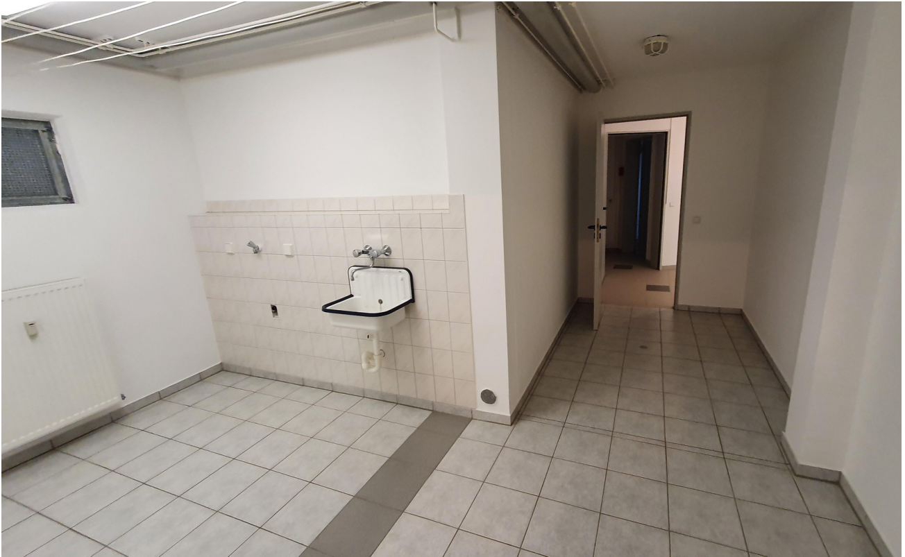
Raum 1 KG (Waschk.) (optional)