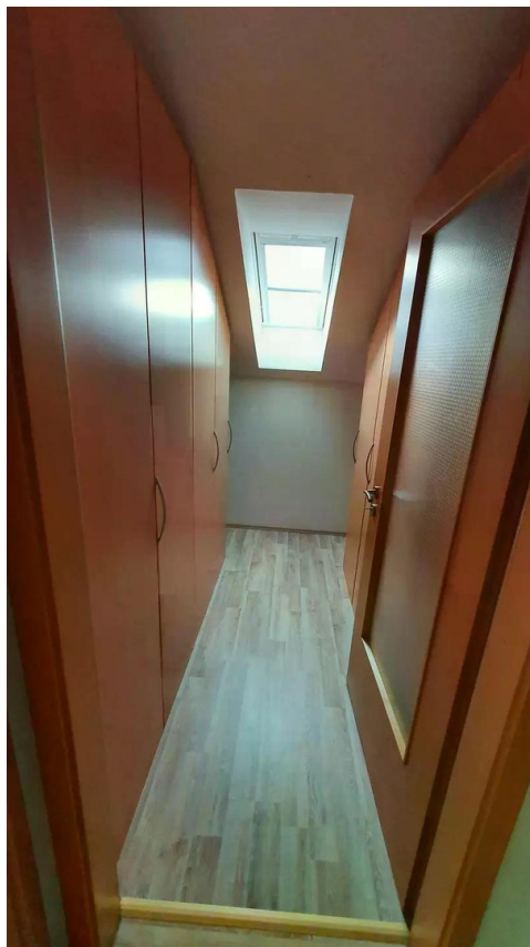
Raum 1 DG