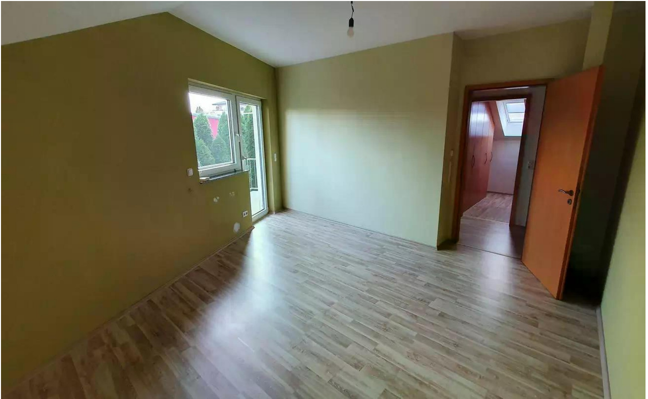
Raum 3 DG