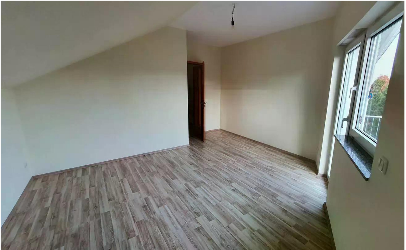
Raum 2 DG (akutell)