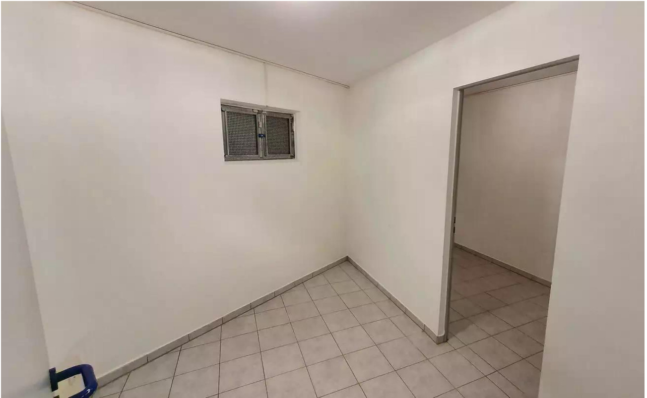
Raum 2 u. 3 KG (optional)