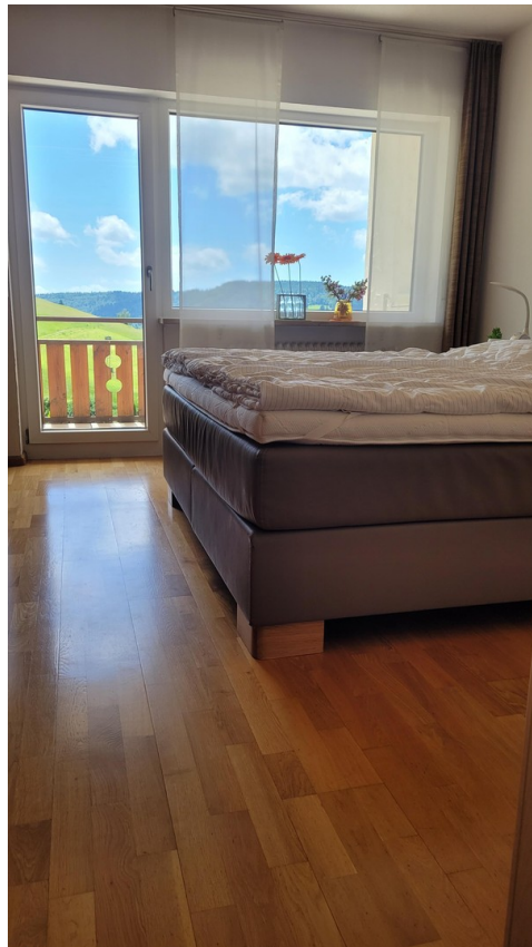
Schlafen mit Aussicht