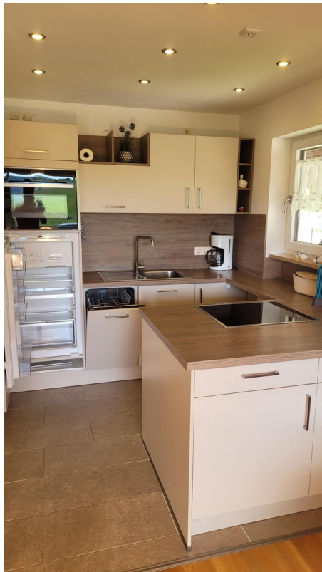
Induktionsherd - Spülmaschine