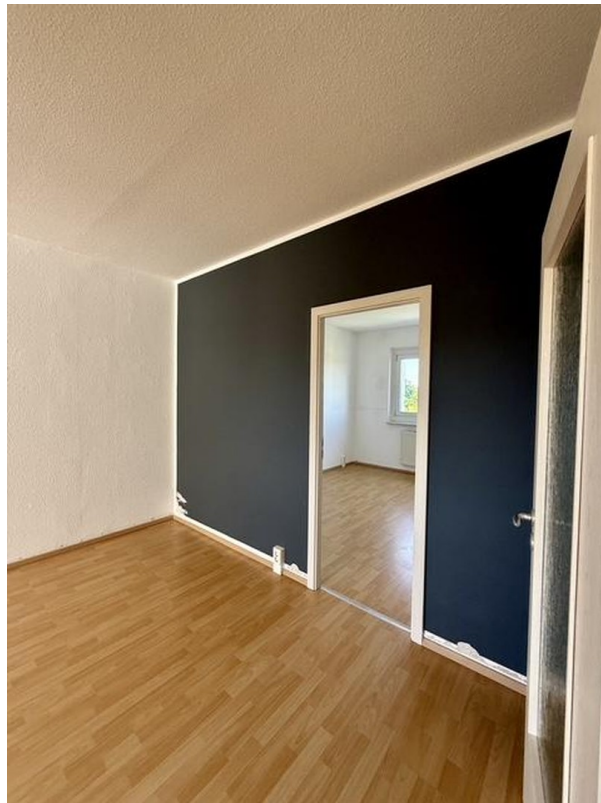
Zimmer 3 Eingang über WZ