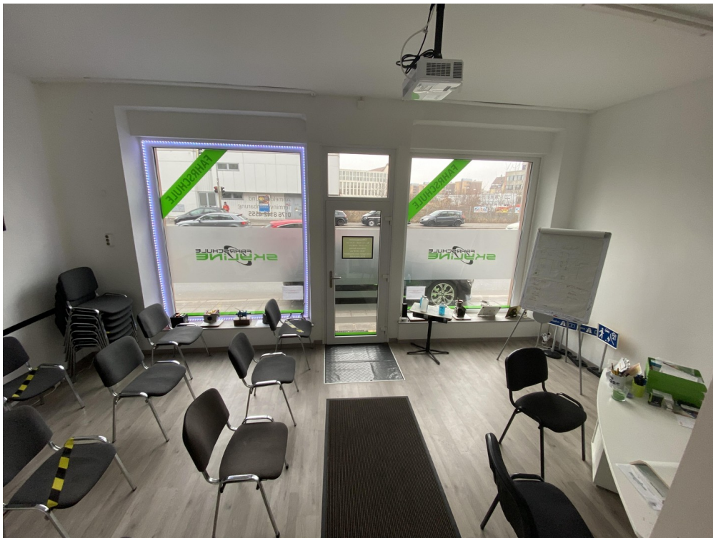
Unterrichtsraum m Arbeitsplatz