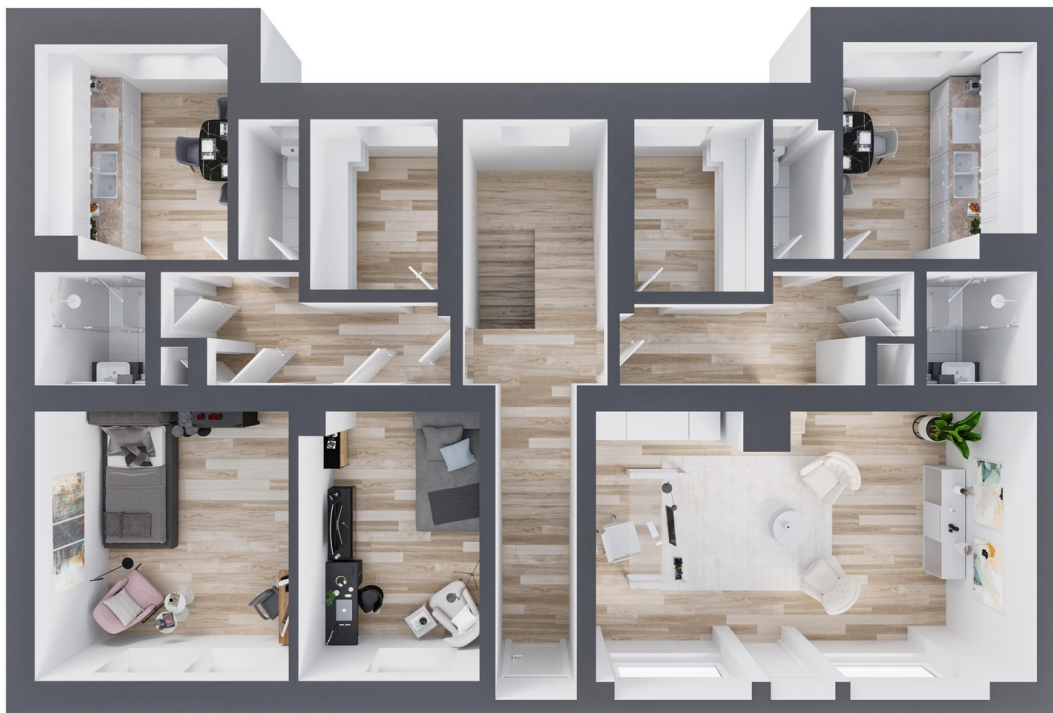
Grundriss EG, FS: rechte Seite