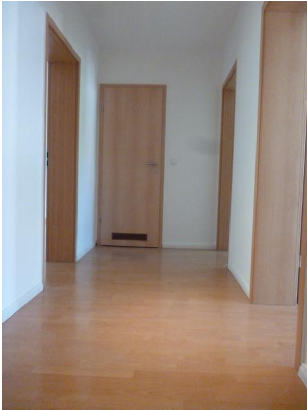
Diele Blickrichtung Bad