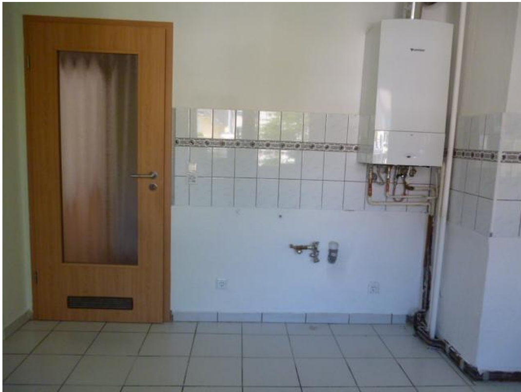
Küche mit Therme