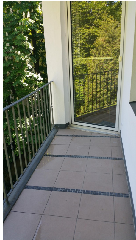
Balkon mit Fliesenbelag