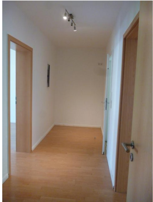
Diele Blickrichtung Eingang