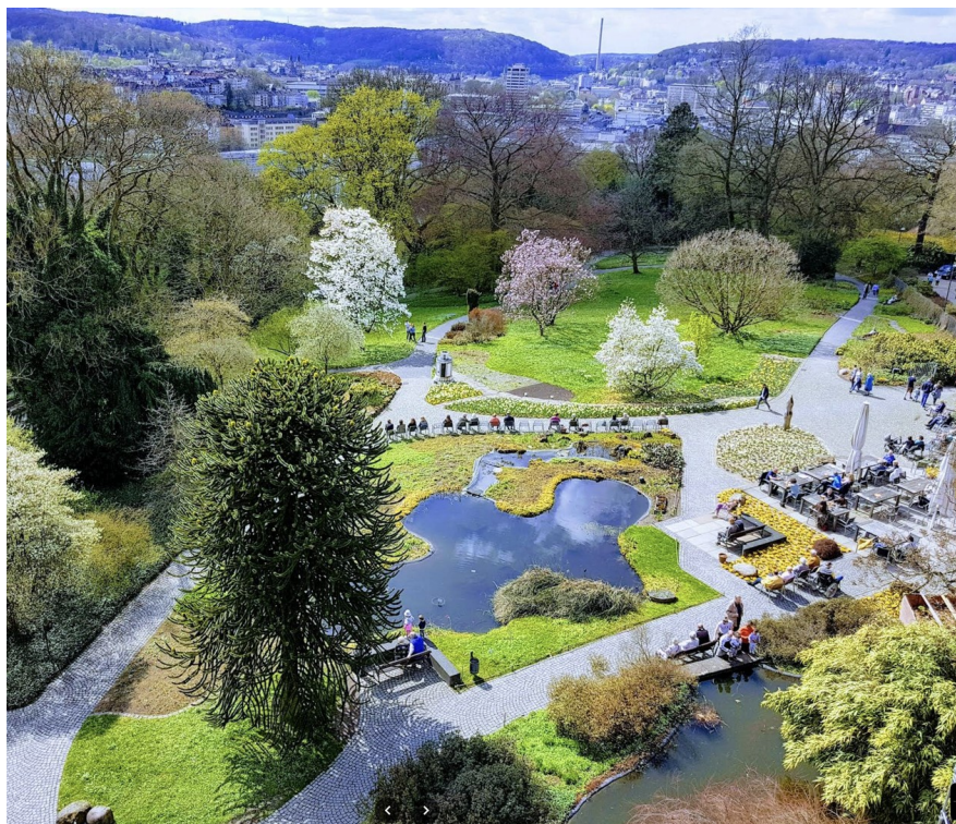
Park in der Nähe