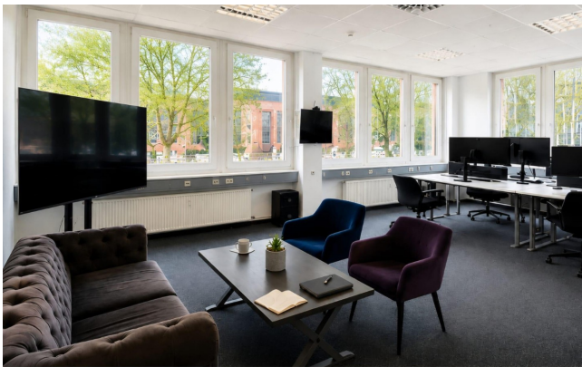
1 Großer Open-Space Heller, großzügiger Arbeitsplatz mit großer Fensterfront, Teppichboden, Klimaanlage und moderner IT-Verkabelung. Ideal für Teams und flexible Arbeitskonzepte. ☀️ Viel Tageslicht 🖨️ IT-Verkabelung ❄️ Klimaanlage 🛋️ Teppichboden

Nachmieter gesucht | 410 m 2 Bürofläche | ab 8,99 €/m 2 netto | 4 Stellplätze | Berlin-Reinickendorf