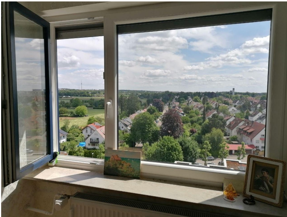
Blick aus Zimmer 1 und 2