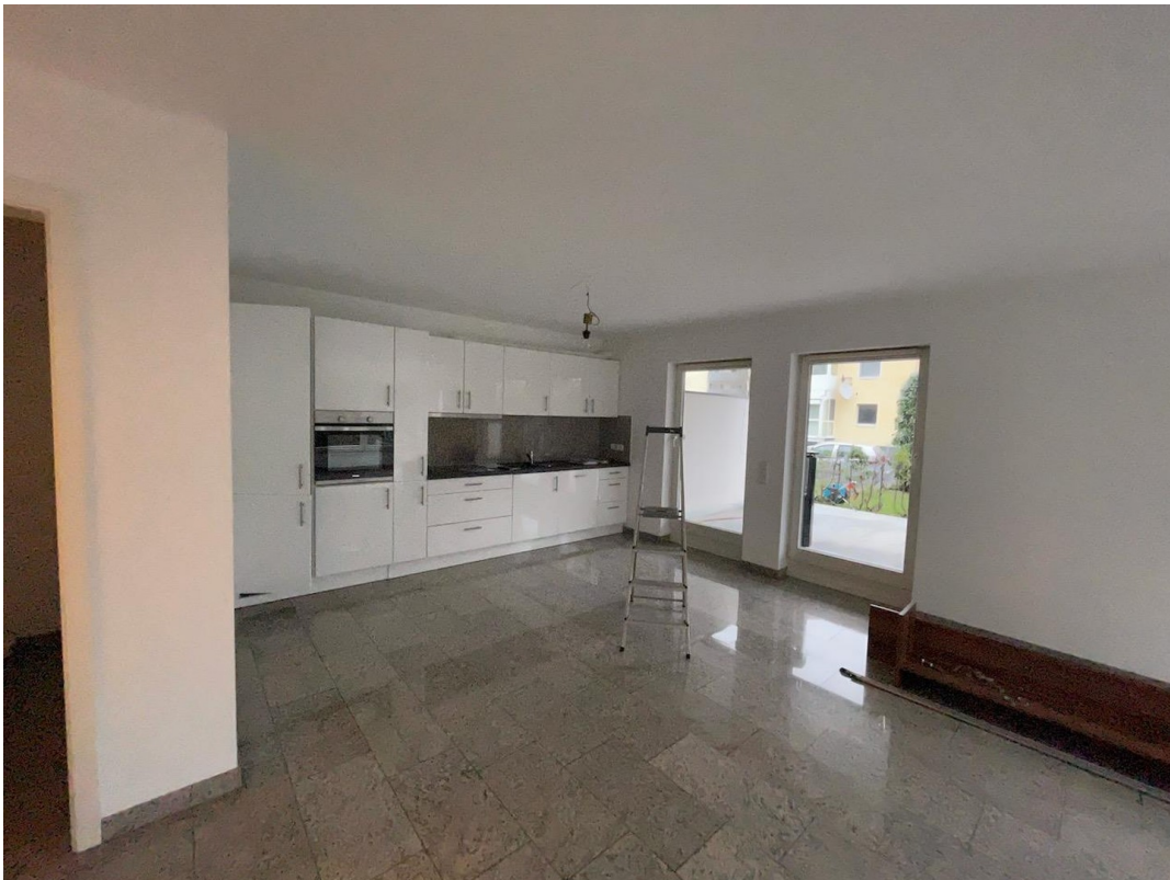
Wohnen / Essen / Küche