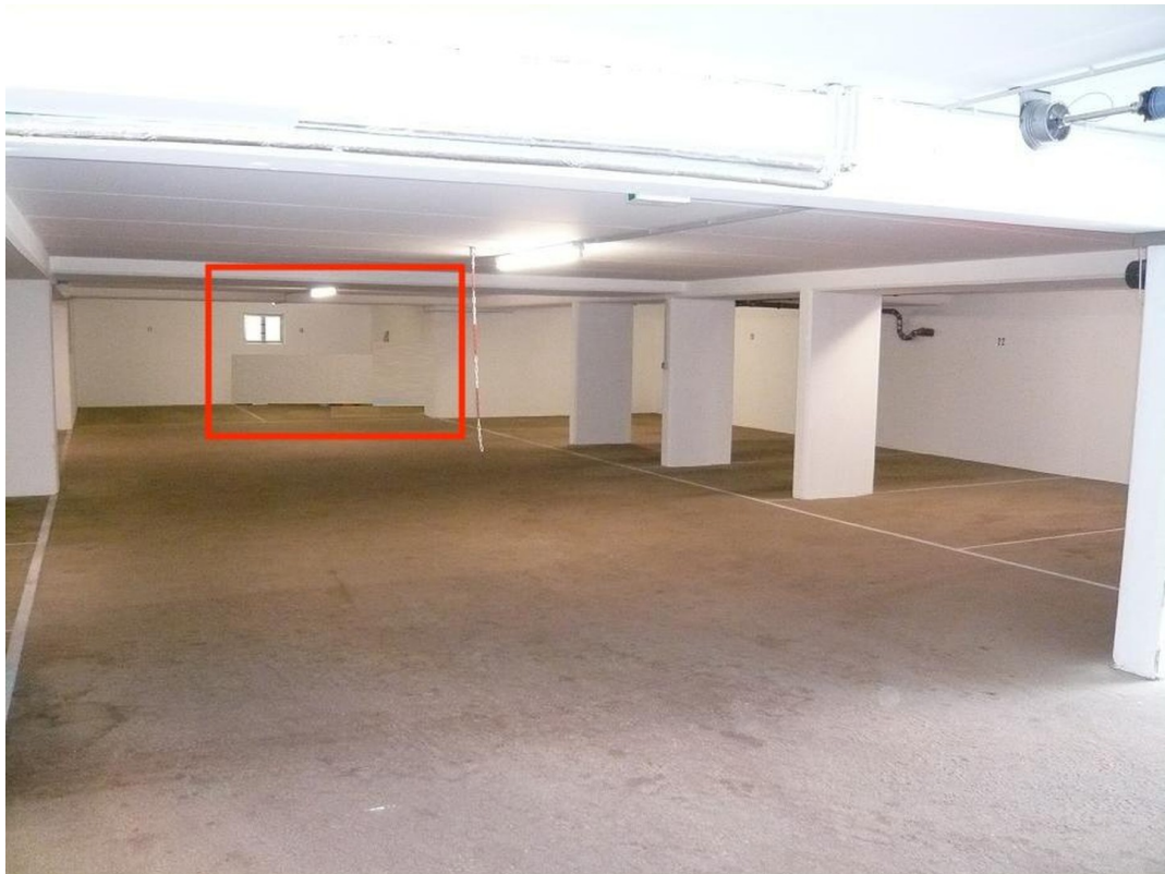
extra breiter TG-Stellplatz