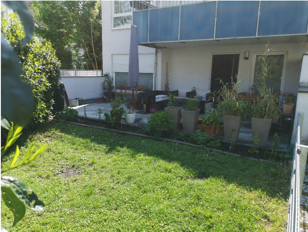
Garten / Terrasse 1