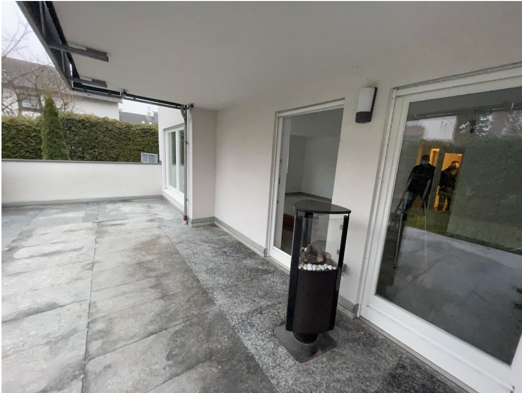
Garten / Terrasse 1