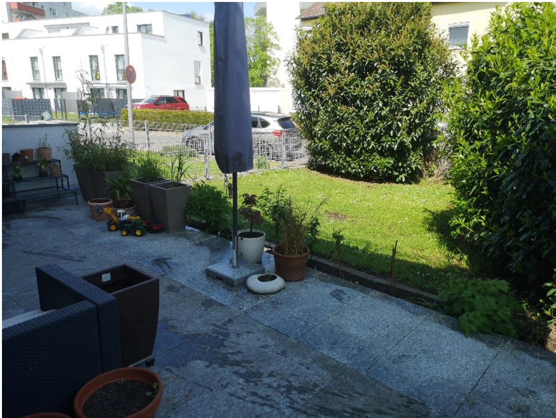
Garten / Terrasse 1