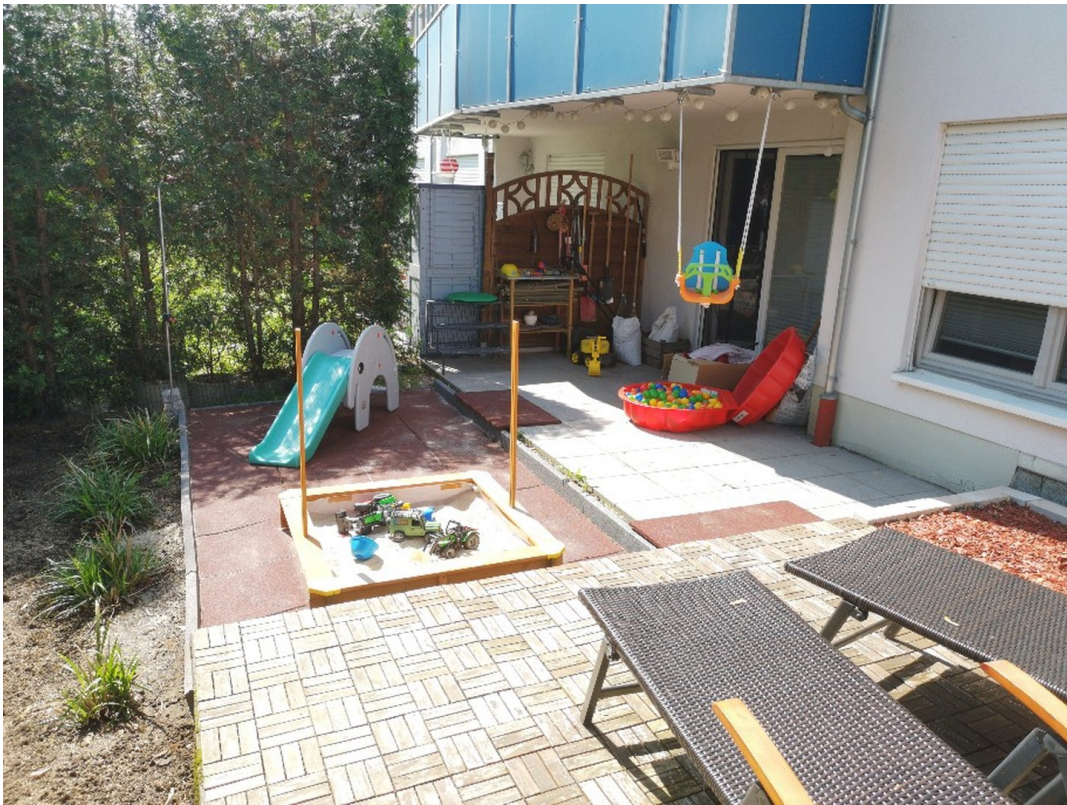
Terrasse 2 - Gestaltungsbeispi