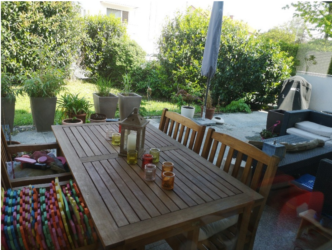
Garten / Terrasse 1