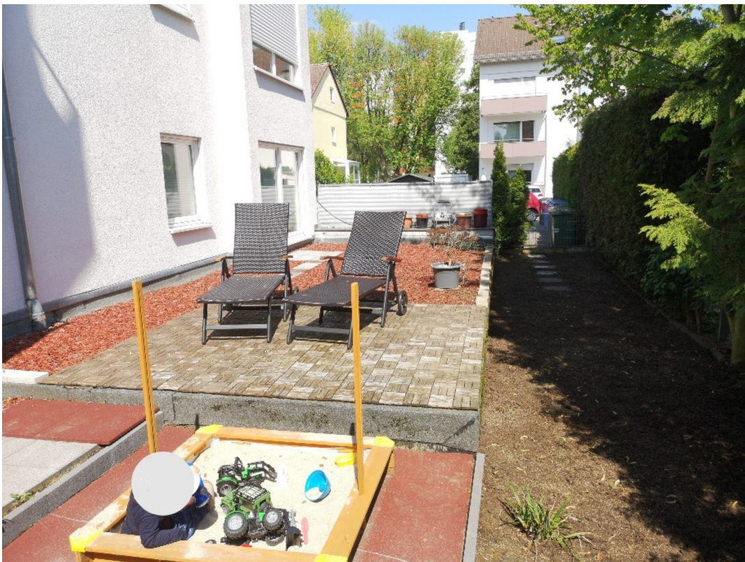
Terrasse 2 - Gestaltungsbeispi