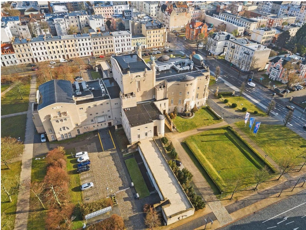
Lage des Gebäudes