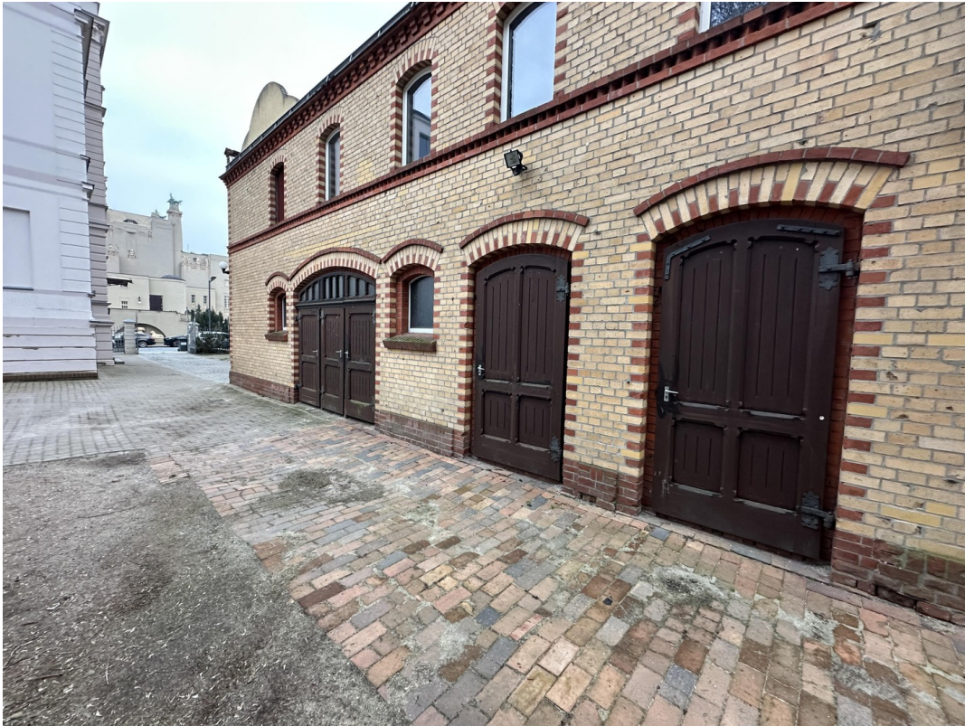
Kutcherhaus auf dem Grundstück