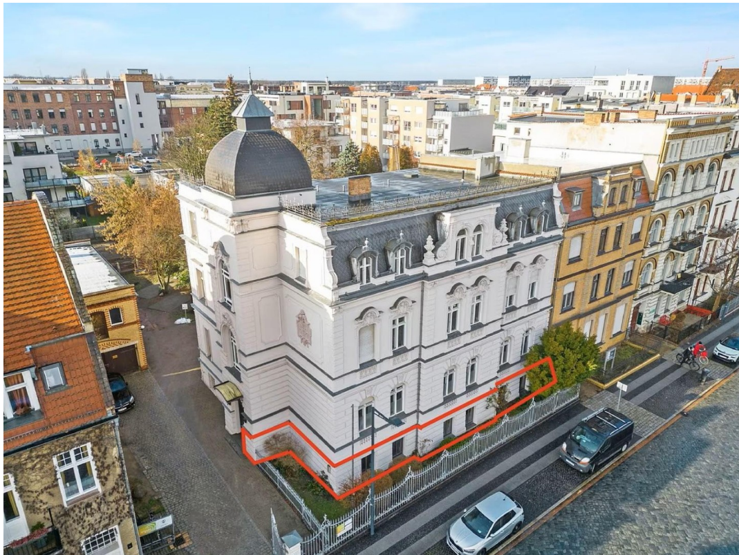
Lage der Räume