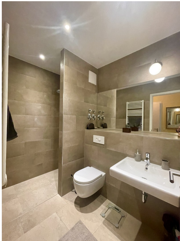
Elternbadezimmer mit Dusche