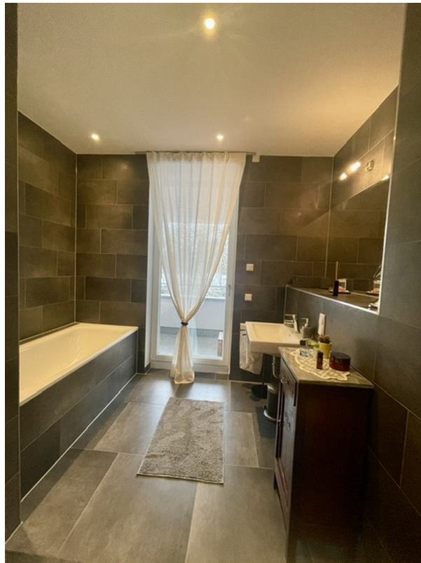
Bad mit Badewanne/Dusche