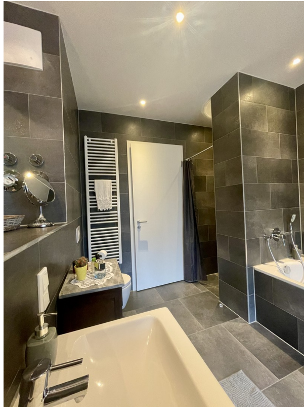
Bad mit Badewanne/Dusche