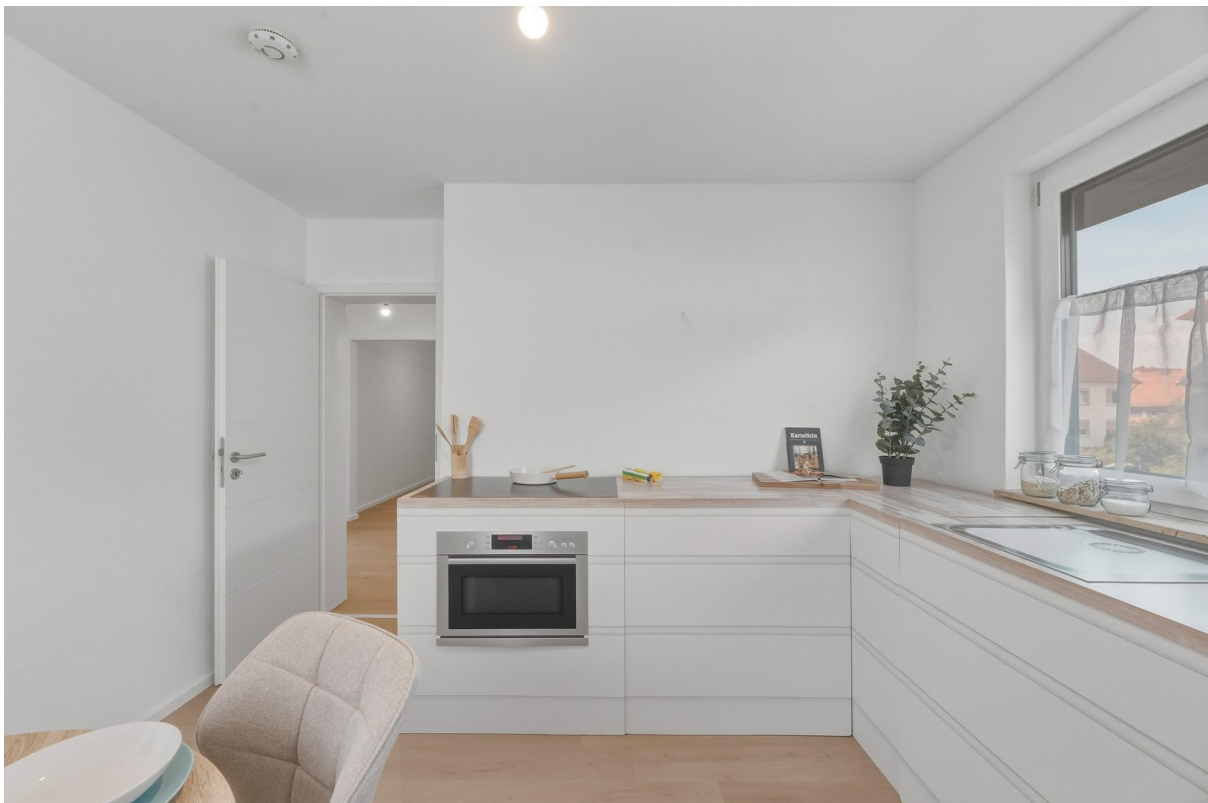
Viel Platz für eine tolle EBK