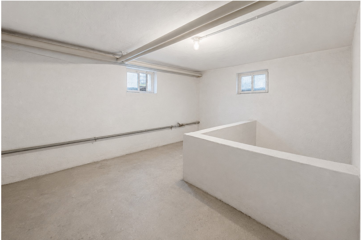
Eigener, großer Kellerraum