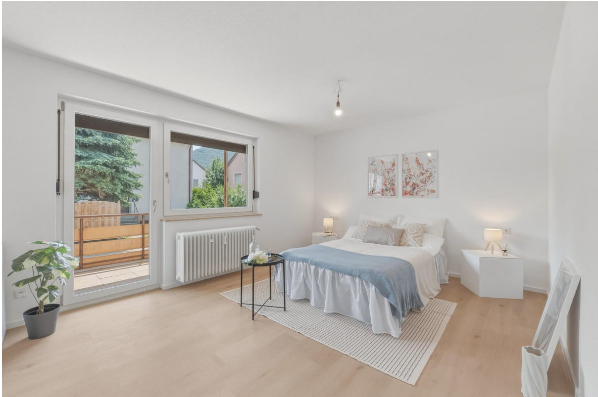
Helles Schlafzimmer mit Balkon