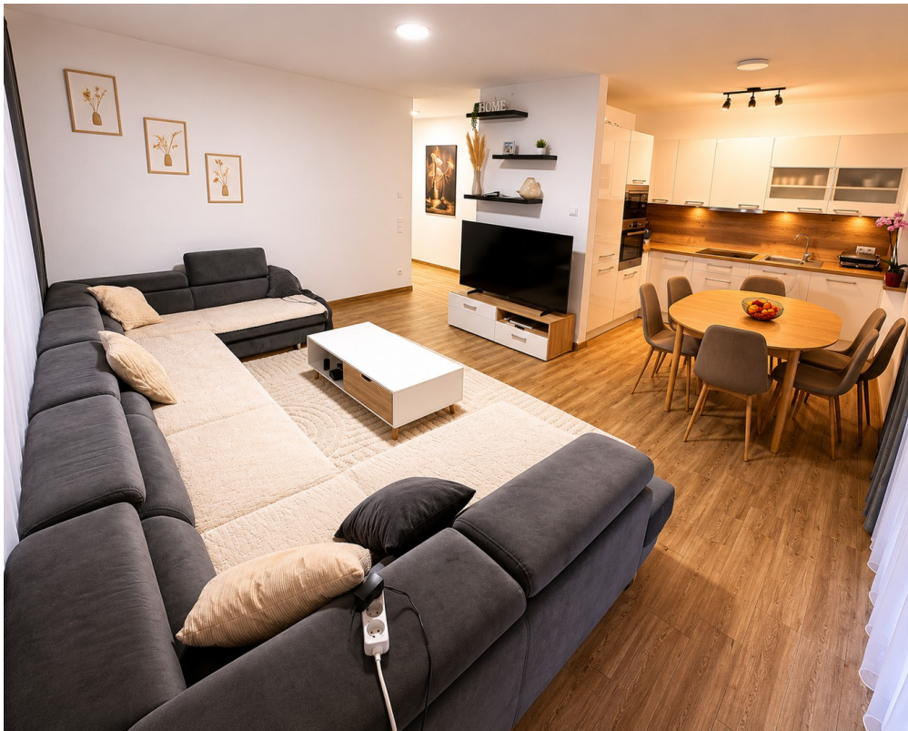
Wohnen Essen Kochen