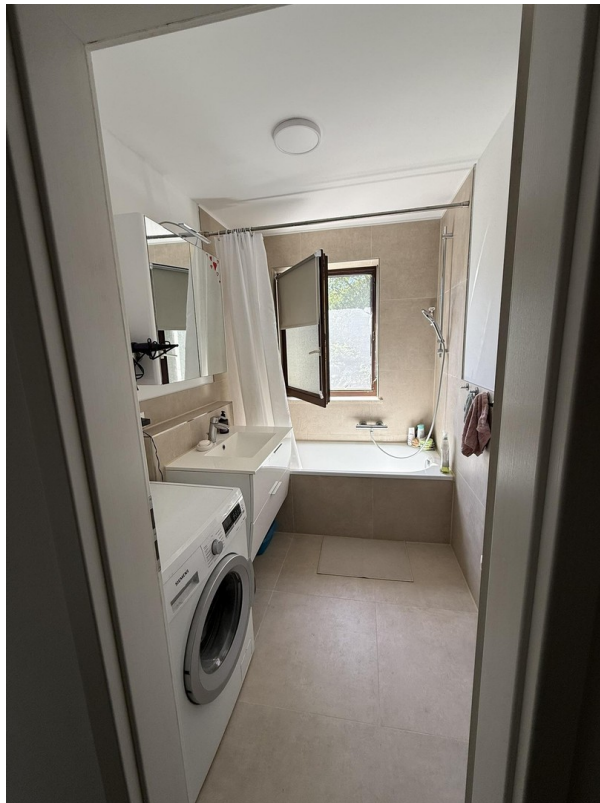
Bad mit Fußbodenheizung (2025)