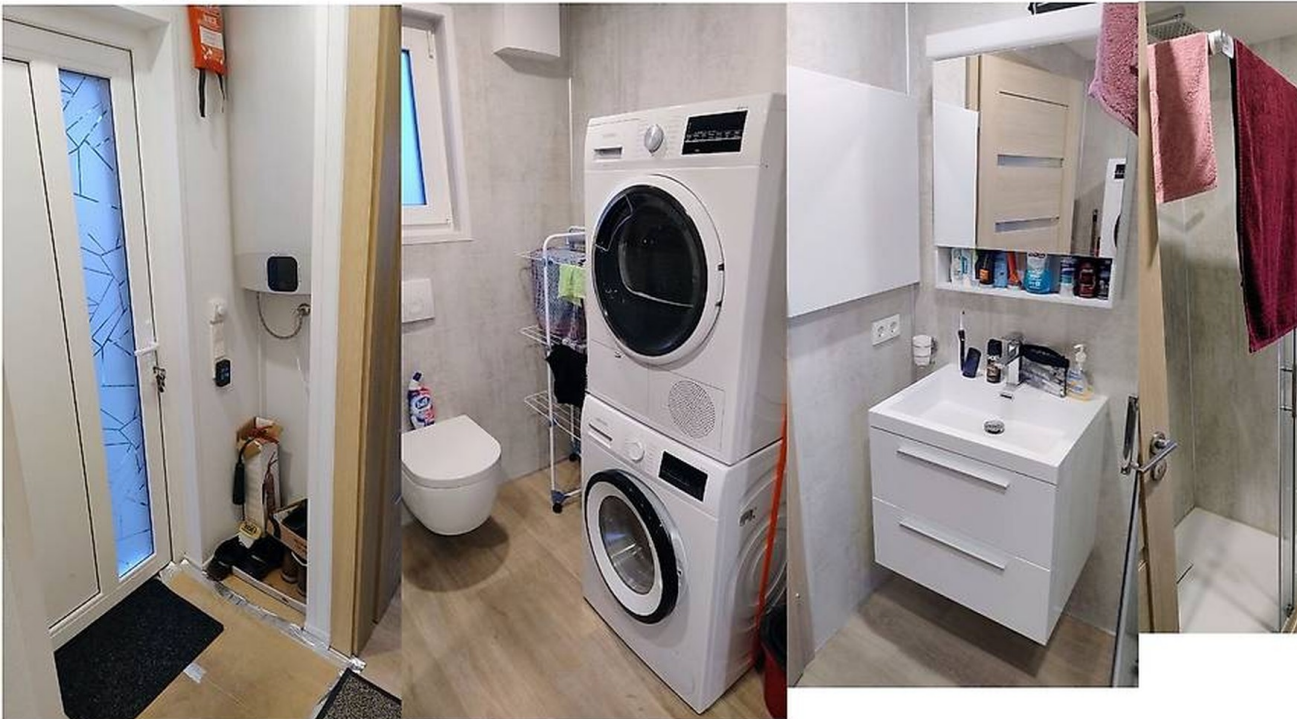
Eingang / Bad