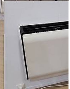
Küche / Wohnzimmer