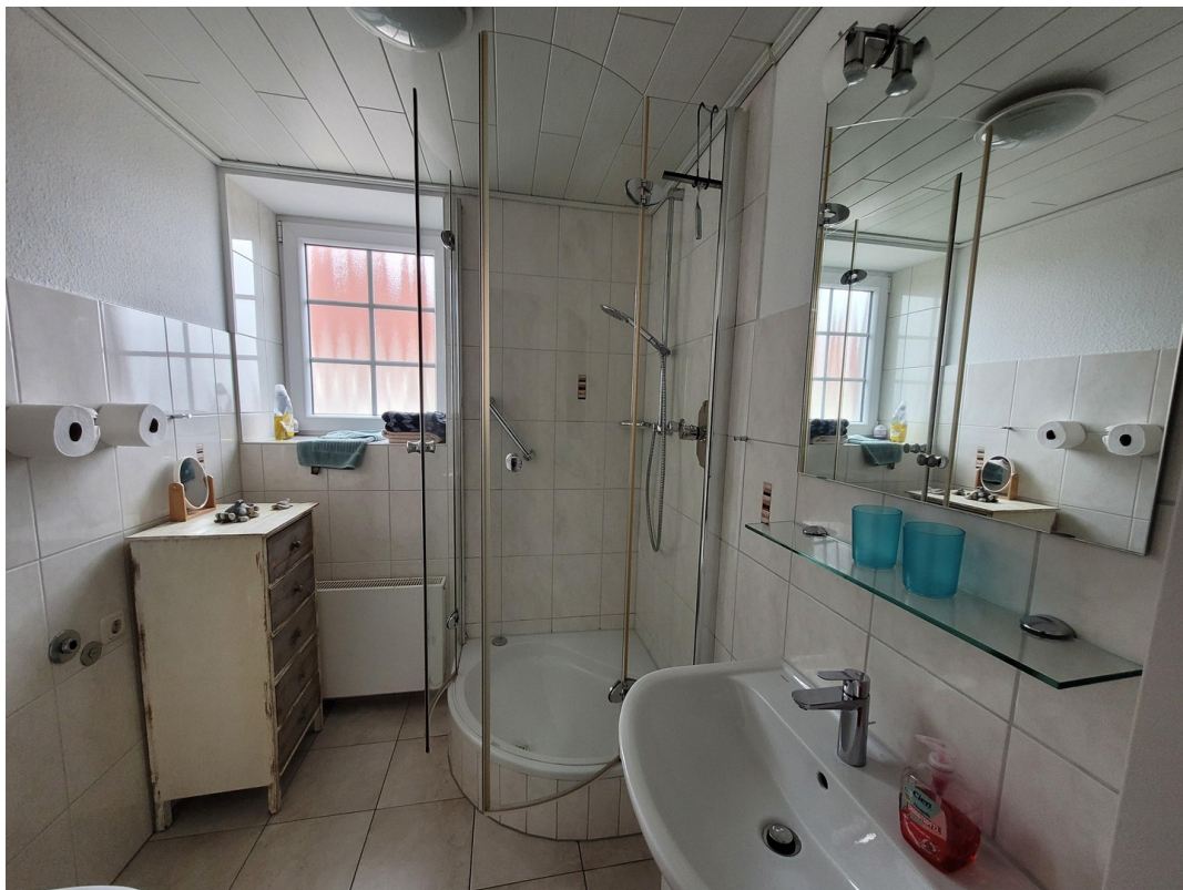
FeWo 1 im 1. Stock