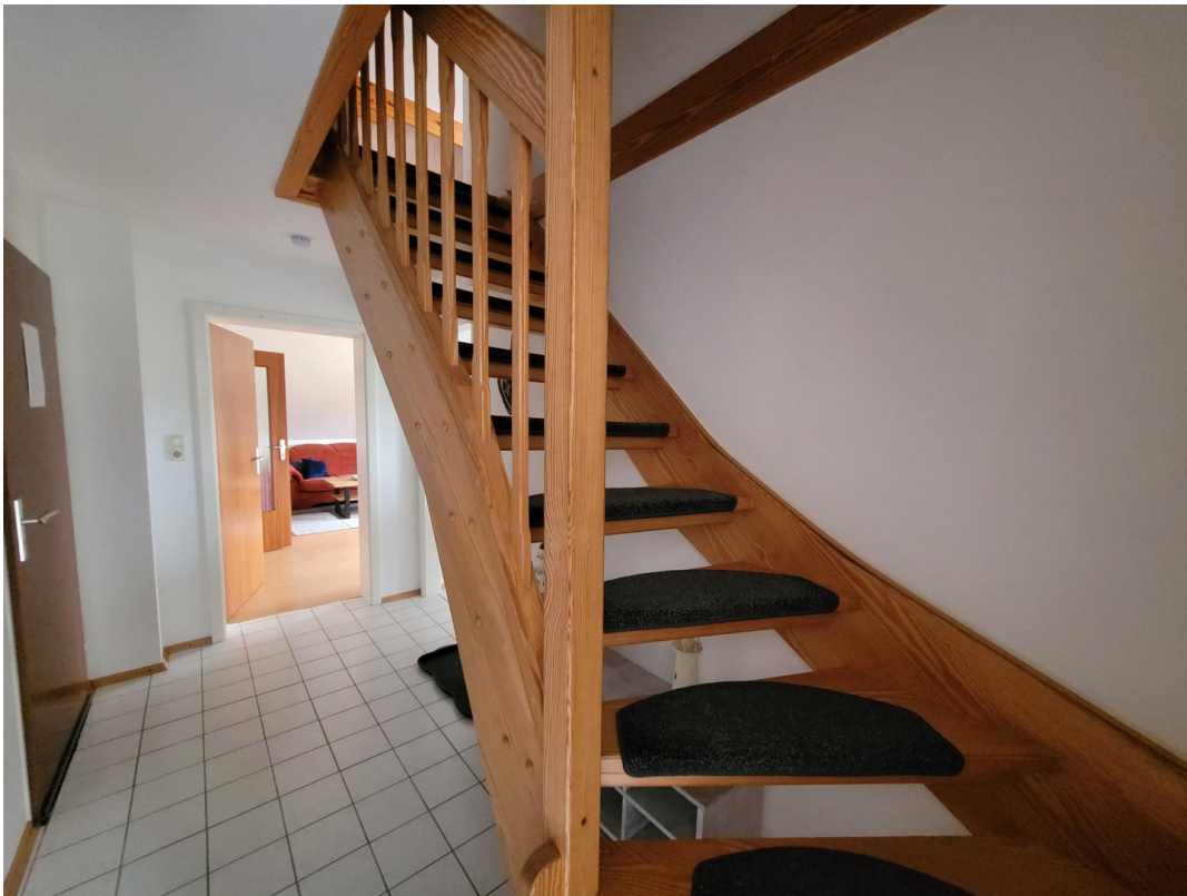
FeWo 3 im 1. Stock