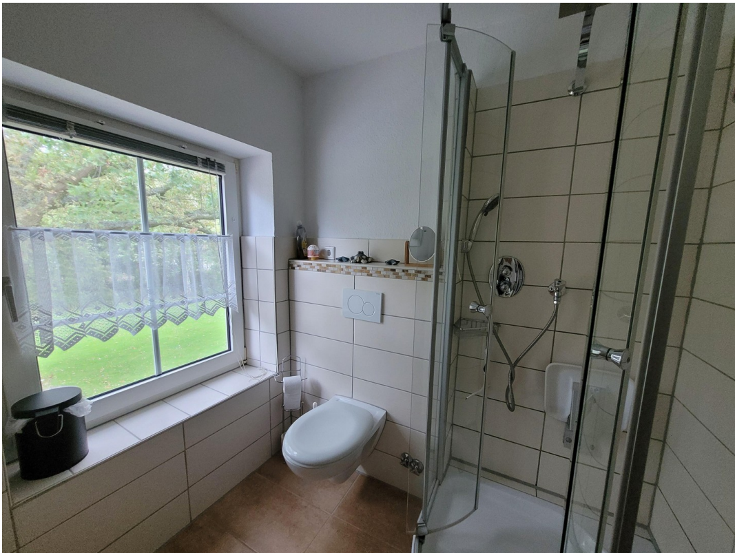
FEwo 2 im 1. Stock