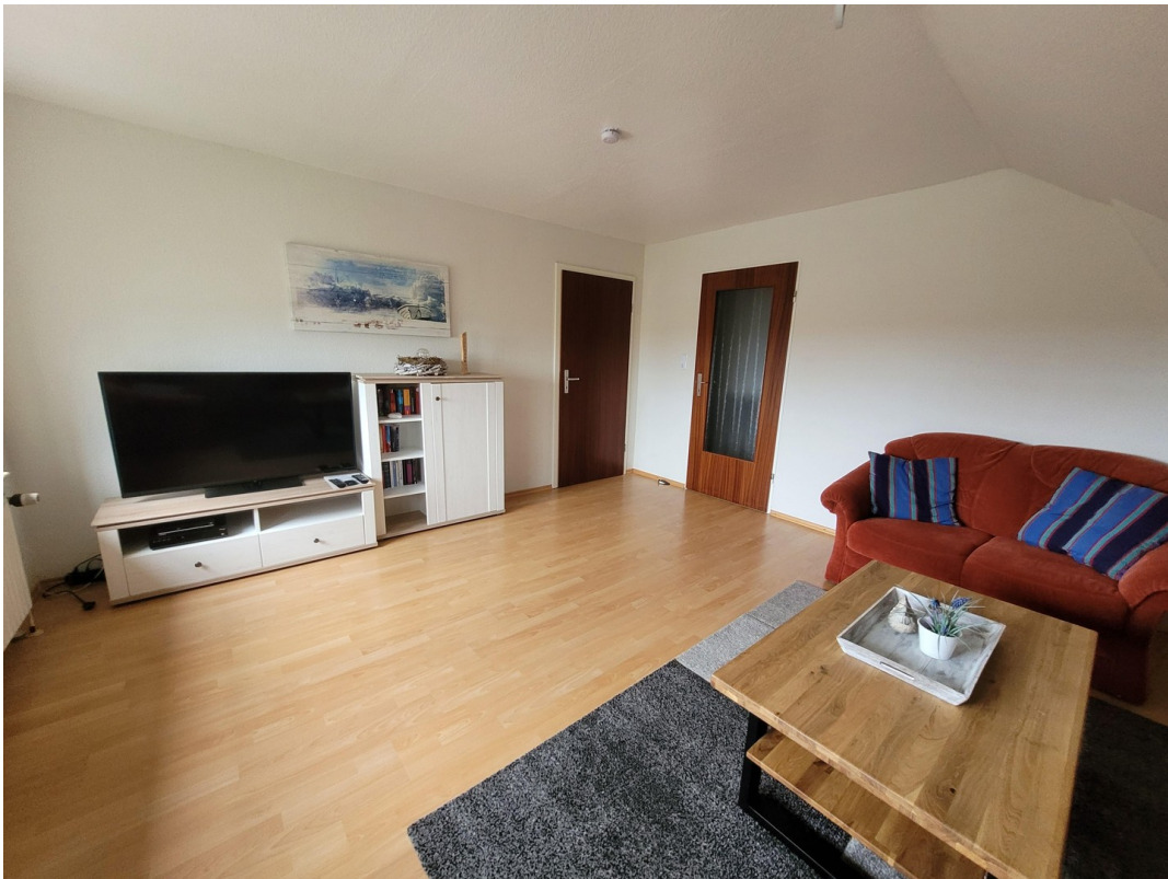
FeWo 3 im 1. Stock