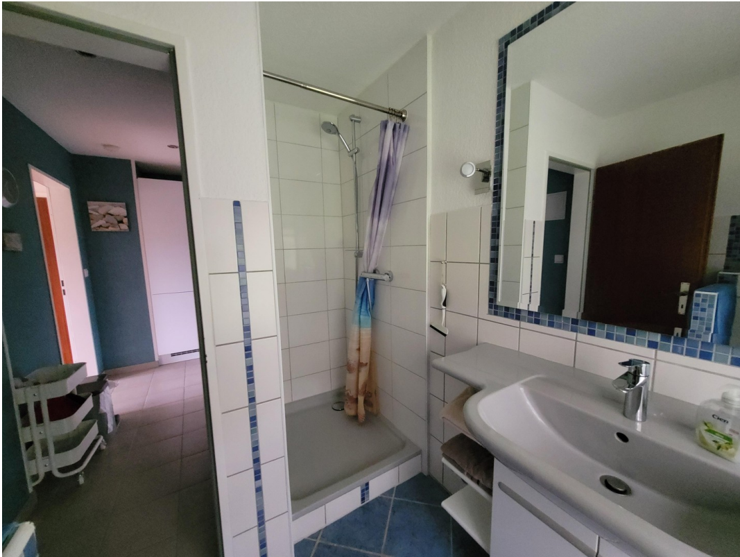
FeWo 3 im 1. Stock