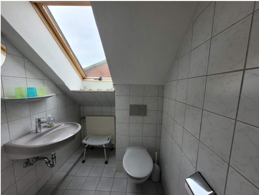
FeWo 3 im 1. Stock