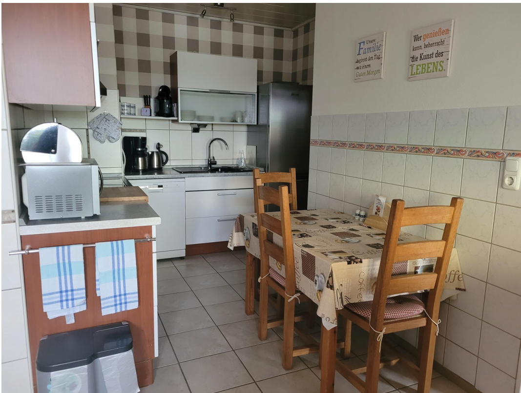
Küche FeWo Erdgeschoß