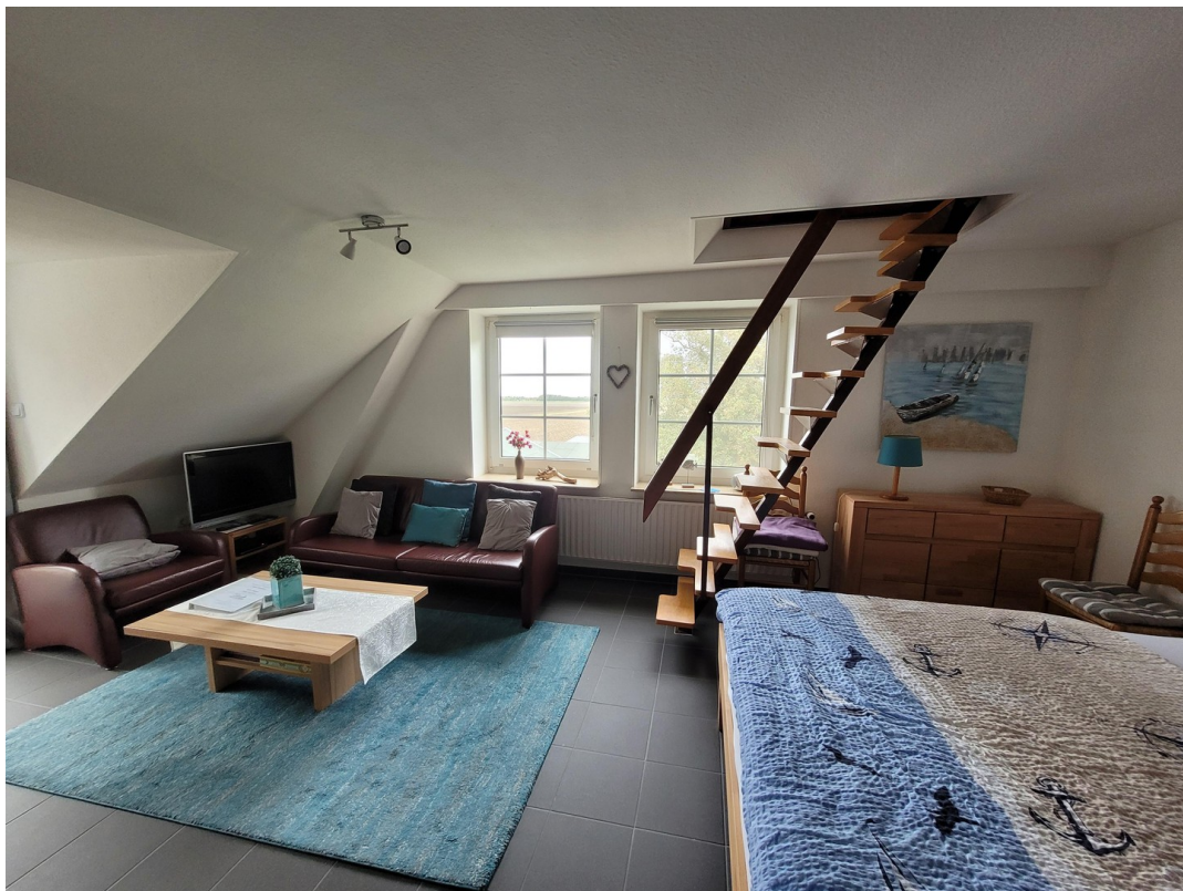
FeWo 1 im 1. Stock