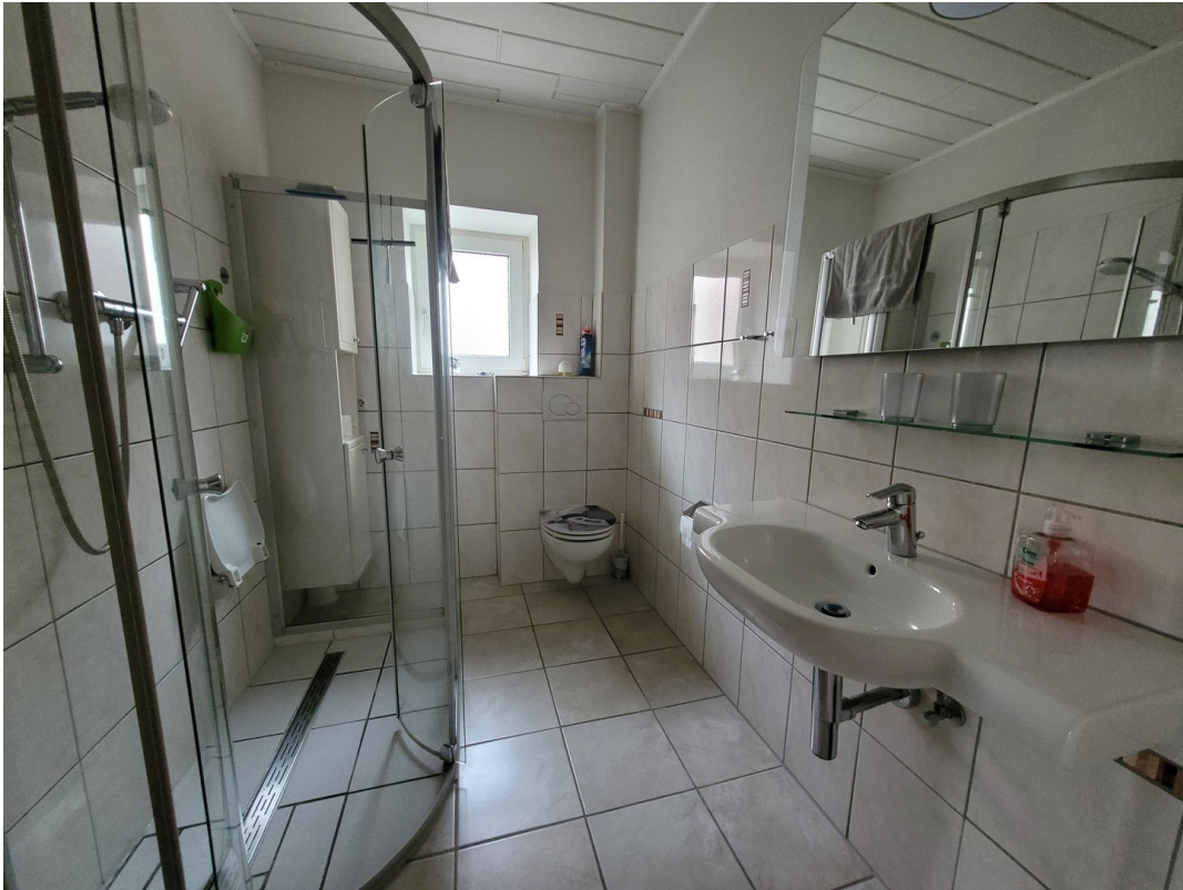
Badezimmer FeWo Erdgeschoß