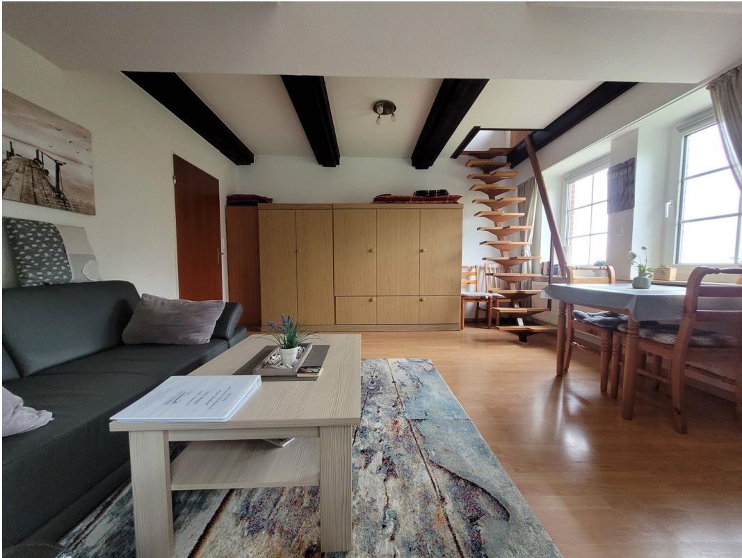
FeWo 2 im 1. Stock