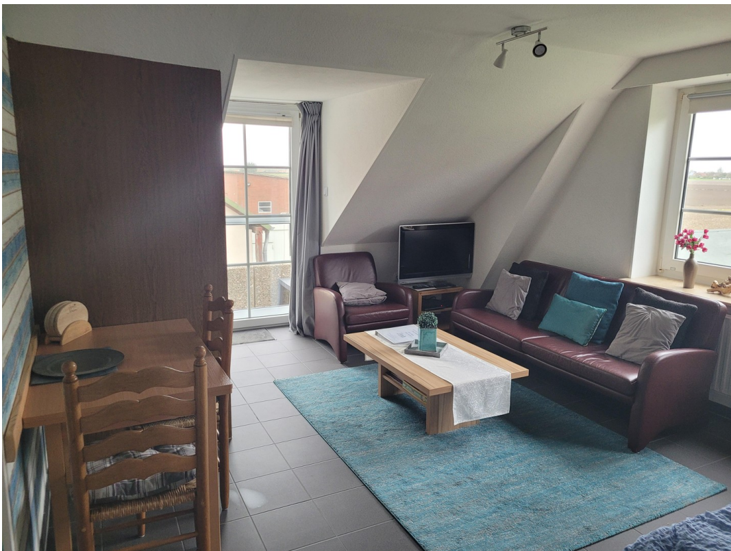
FeWo 1 im 1. Stock