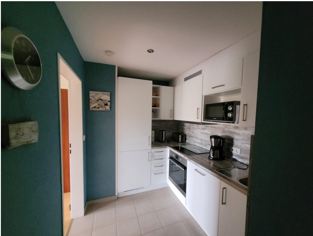
FeWo 3 im 1. Stock