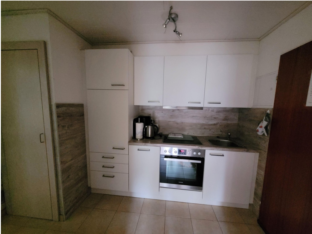
FeWo 2 im 1. Stock