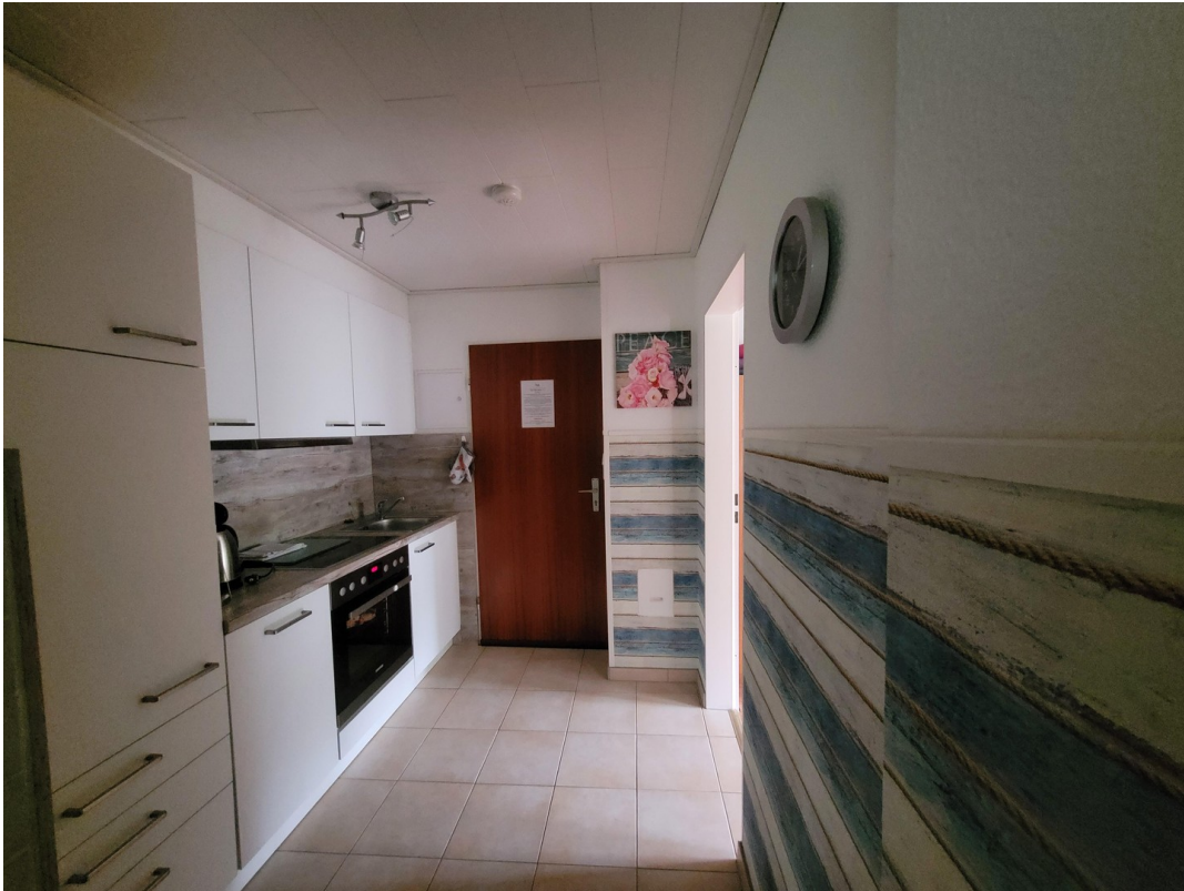
FeWo 2 im 1. Stock