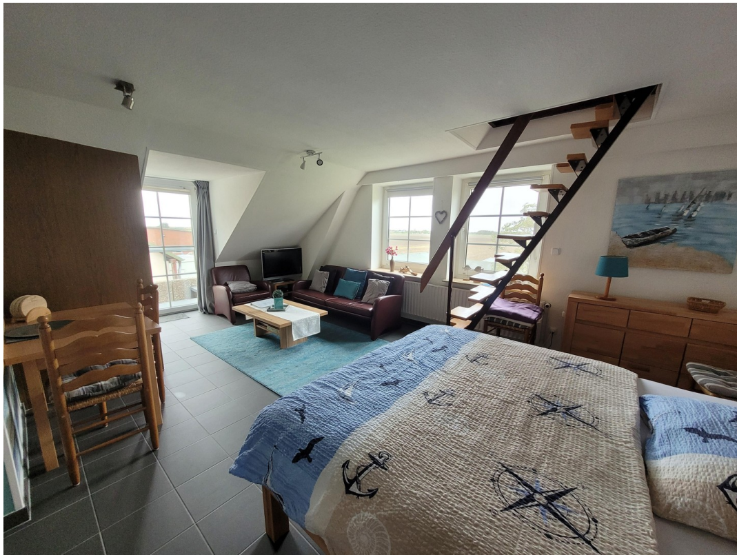
FeWo 1 im 1. Stock