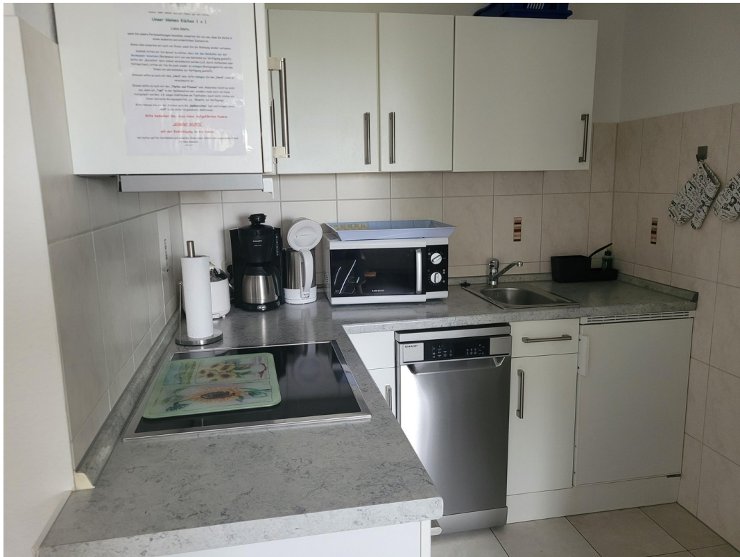
FeWo 1 im 1. Stock