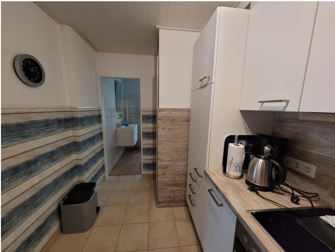
FeWo 2 im 1. Stock