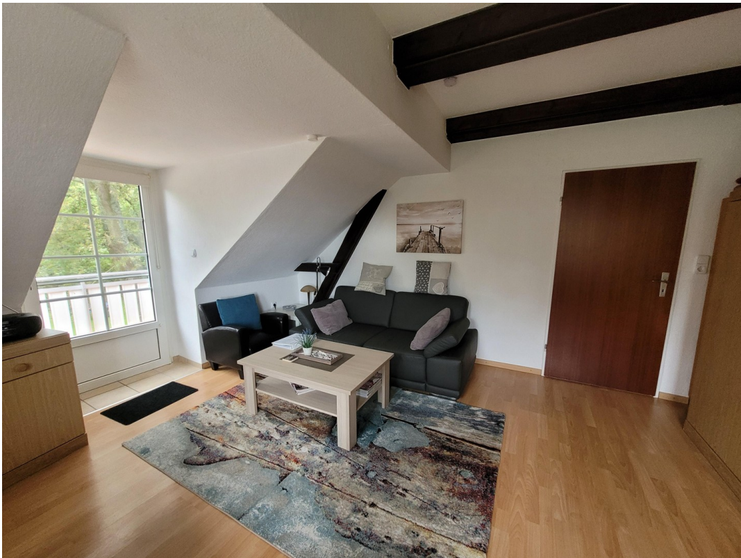
FeWo 2 im 1. Stock