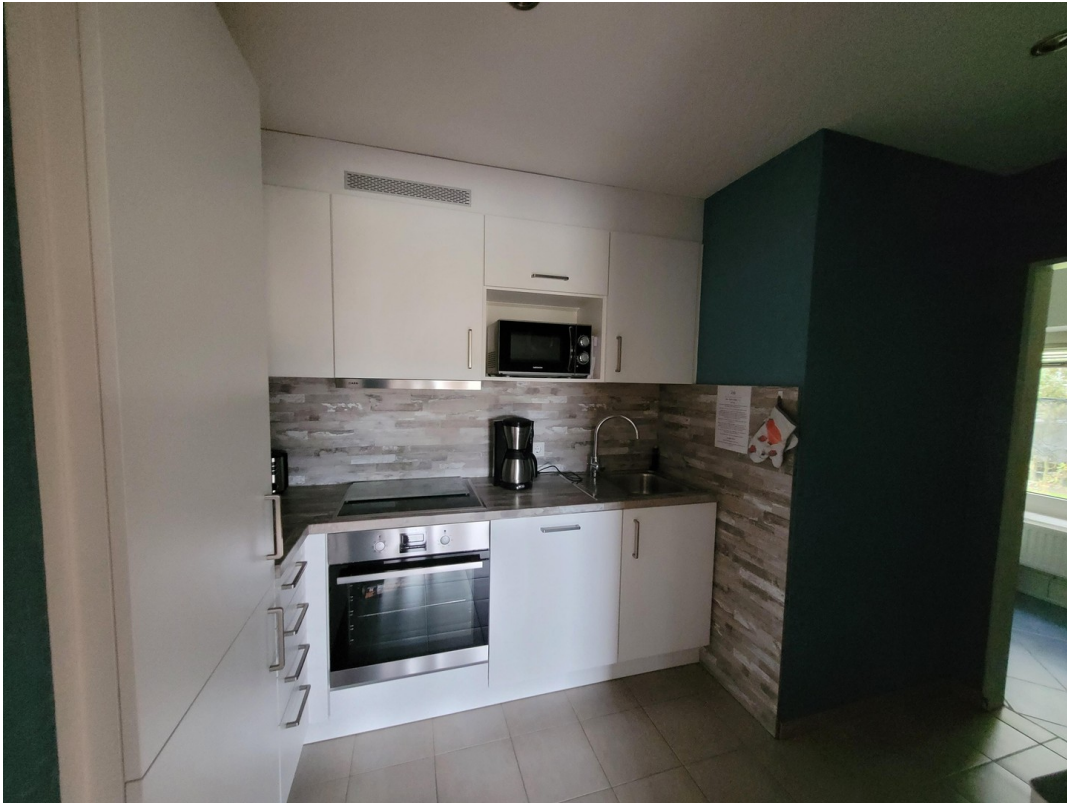
FeWo 3 im 1. Stock