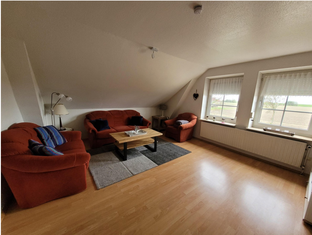
FeWo 3 im 1. Stock