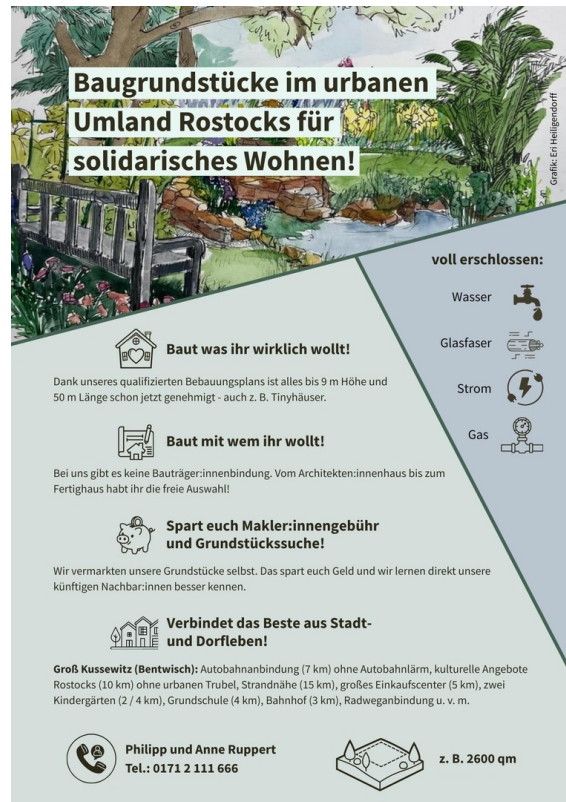
Exposé Seite 1