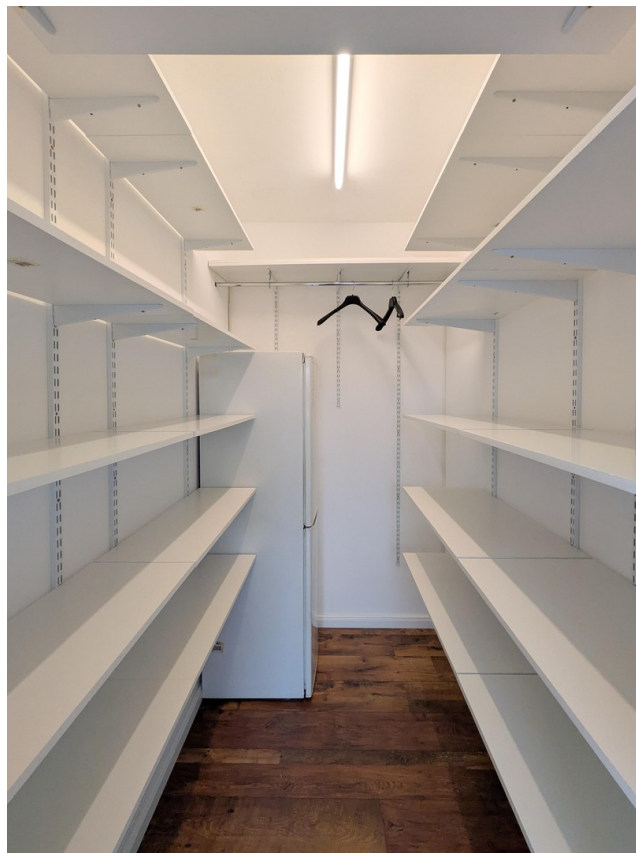
Abstellkammer - Abst 3