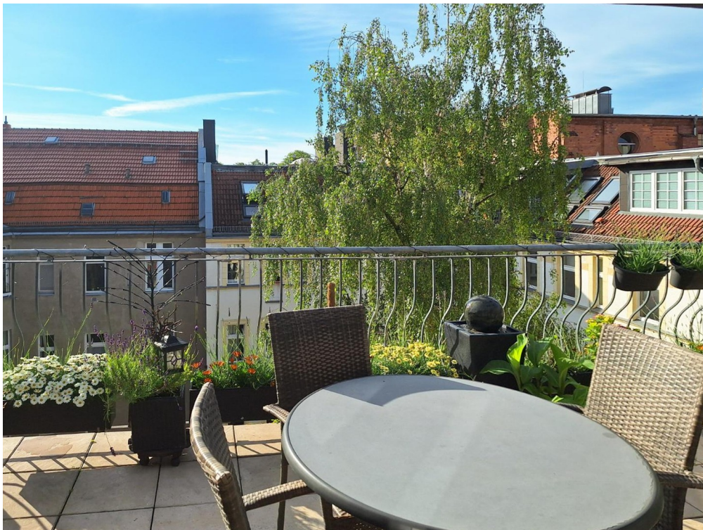
Terrasse - Balkon 1