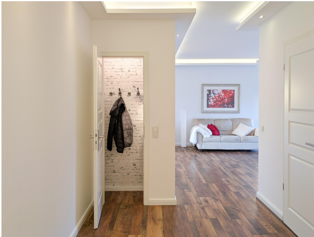
Flur mit Garderobe