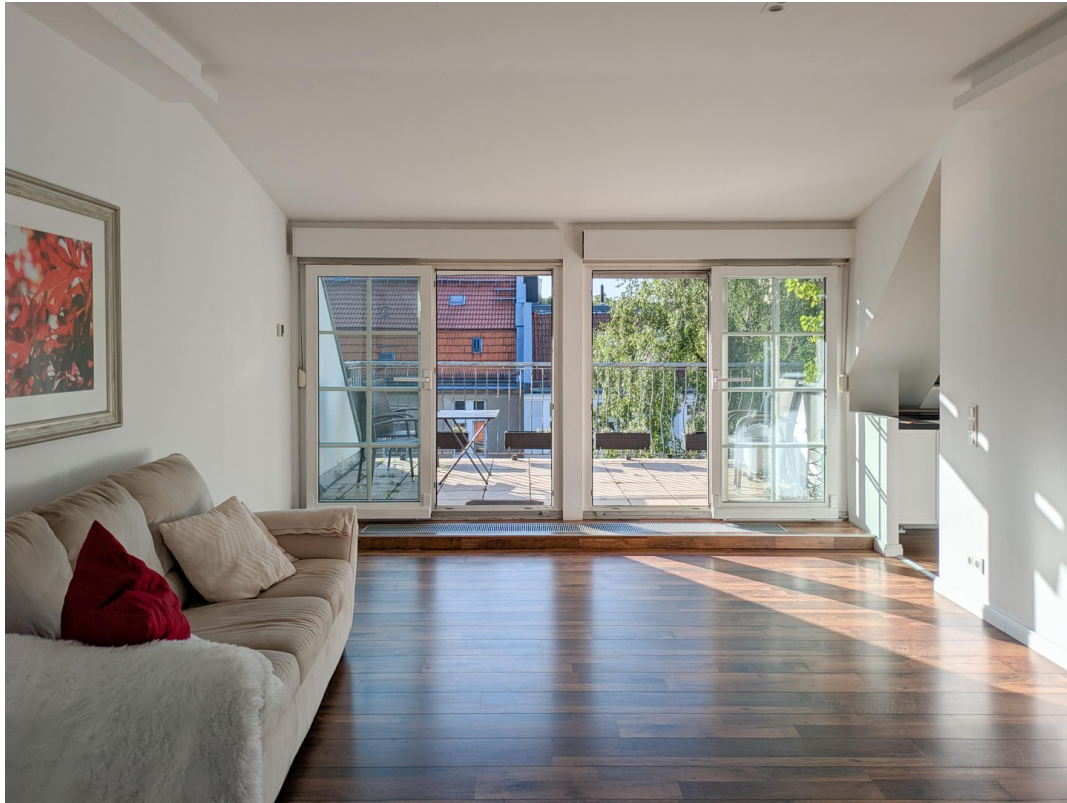
Zimmer 2 und Terrasse