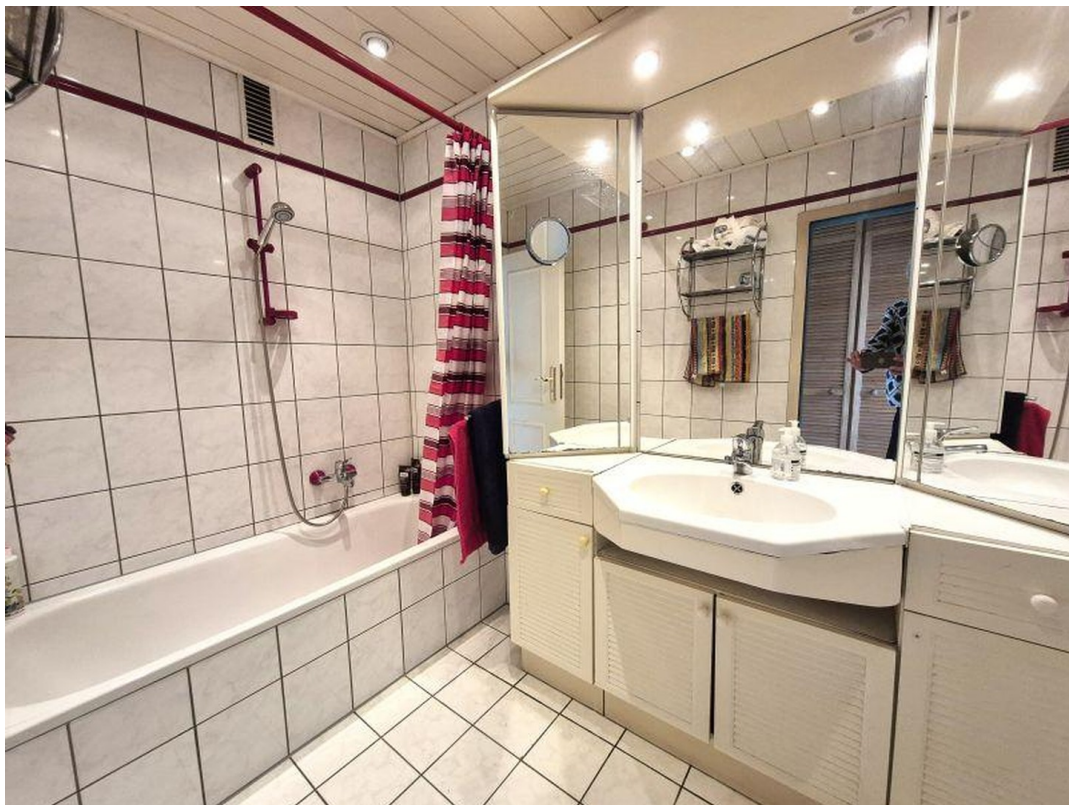
Bad mit Wanne zum Duschen