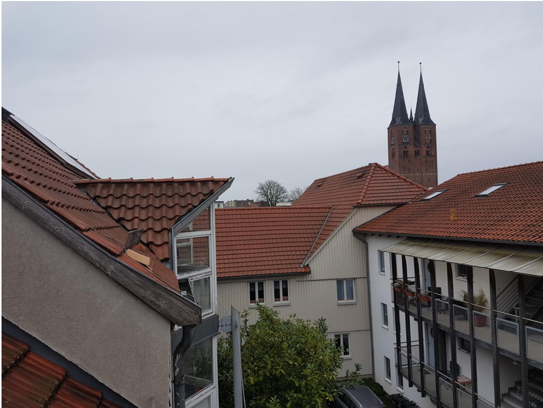
Aussicht vom Balkon v. DG