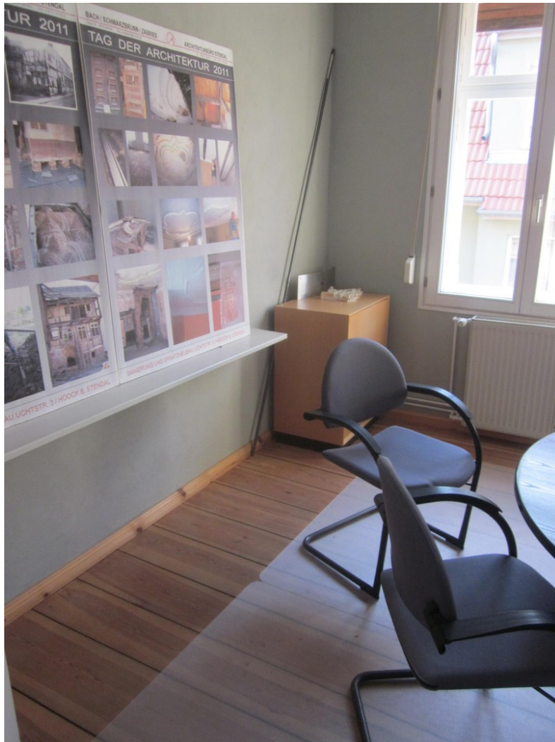
Beispiel nach Sanierung