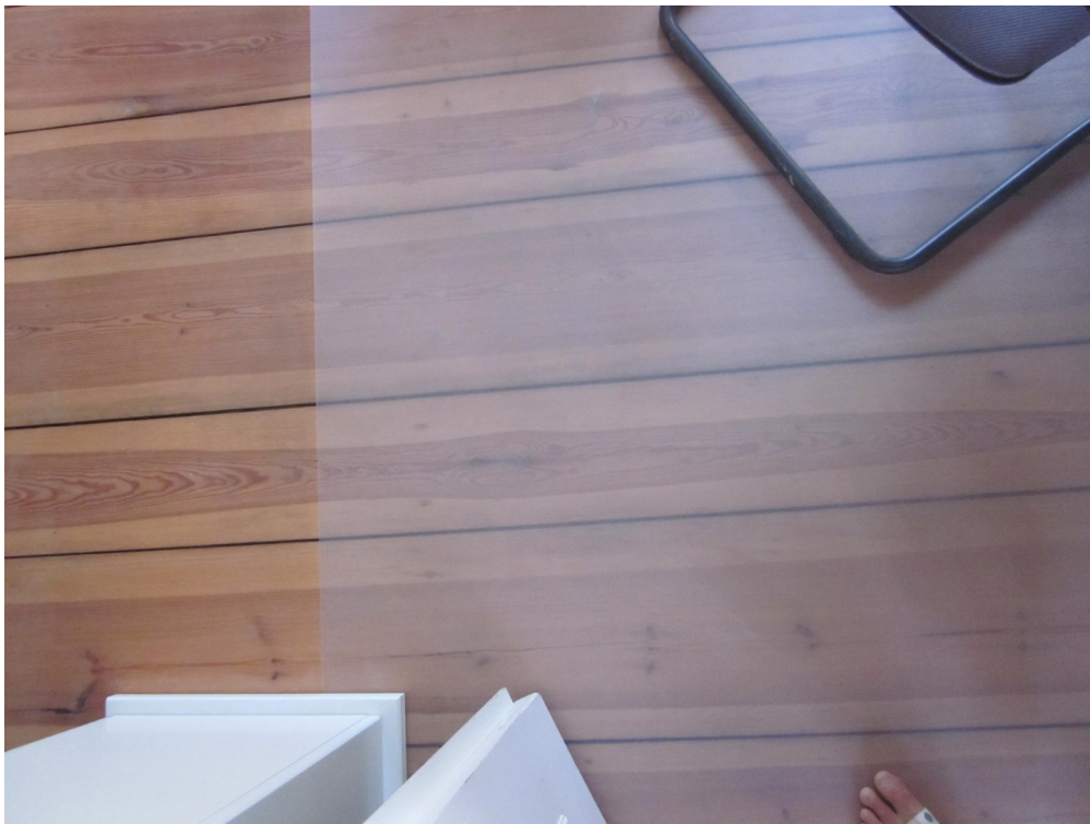
Je nach Zustand Originaldielen