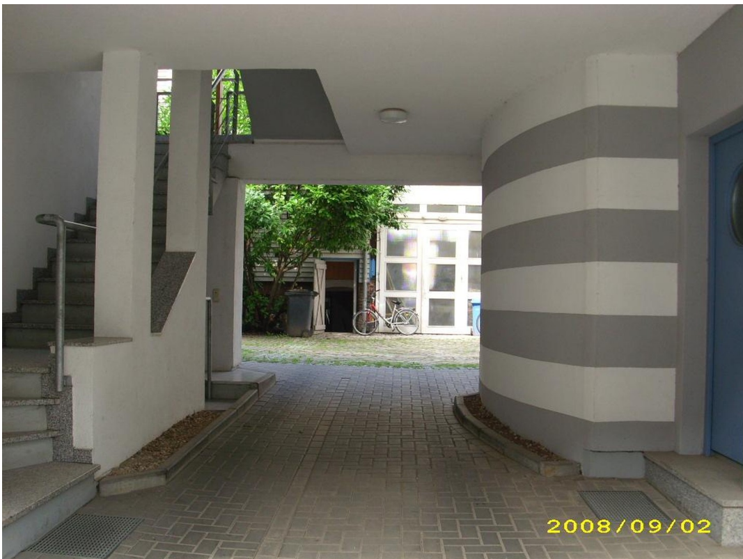
Zufahrt von Uchtstr.