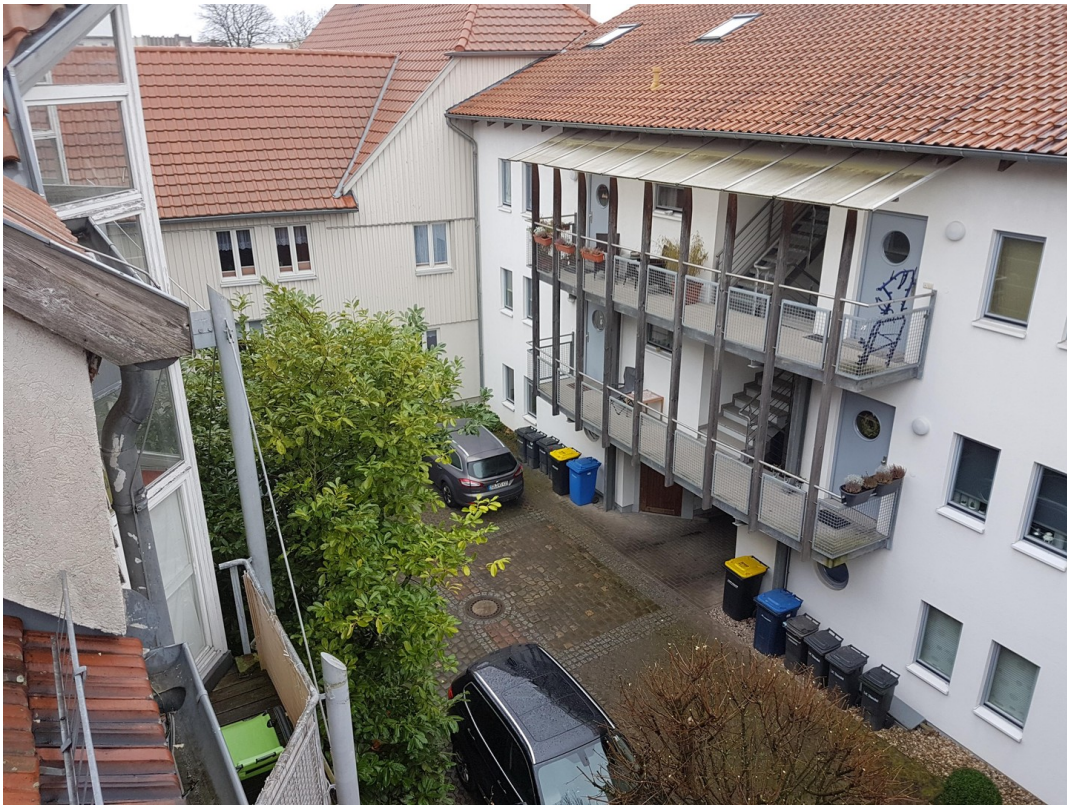
Blick auf Gegenüber