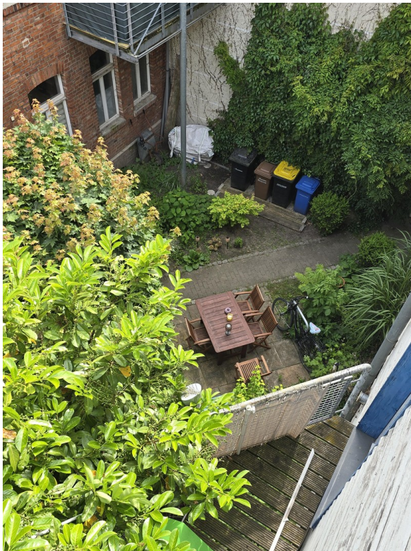
Blick auf Balkon und Terrasse