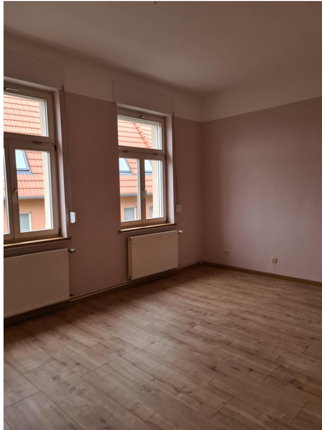
saniertes Wohnraum Beispiel