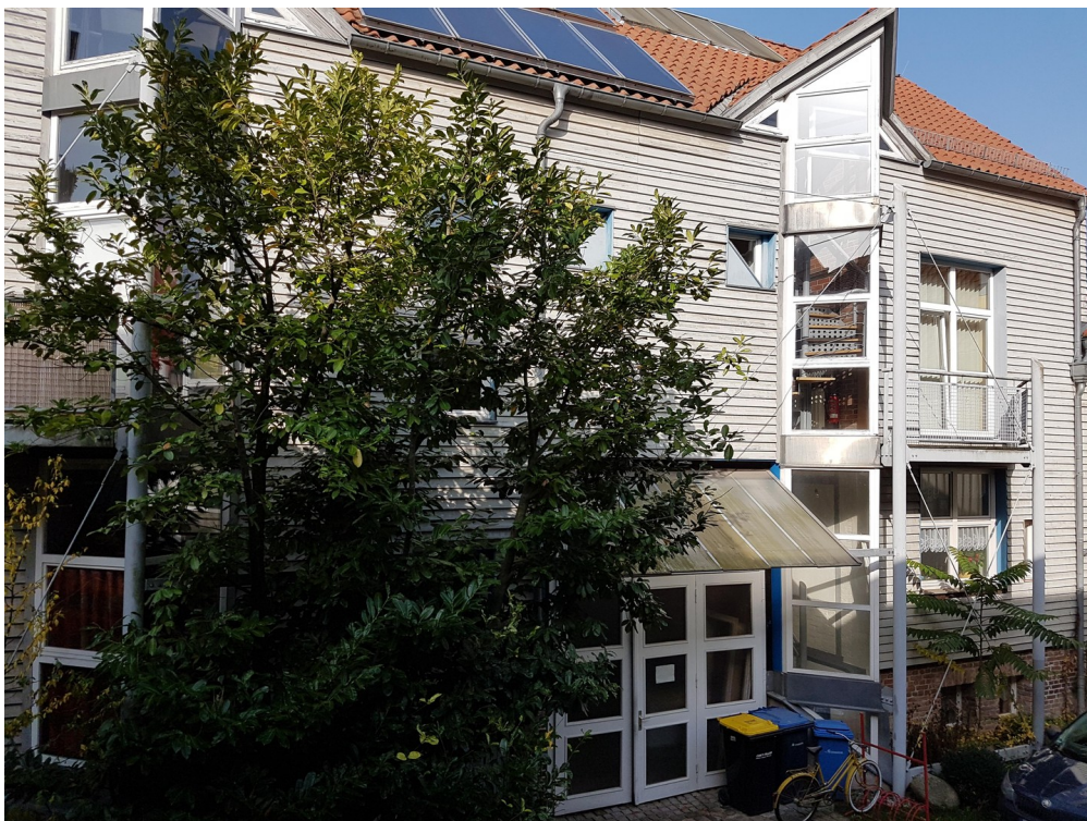
Hoffassade li. OG Balkon