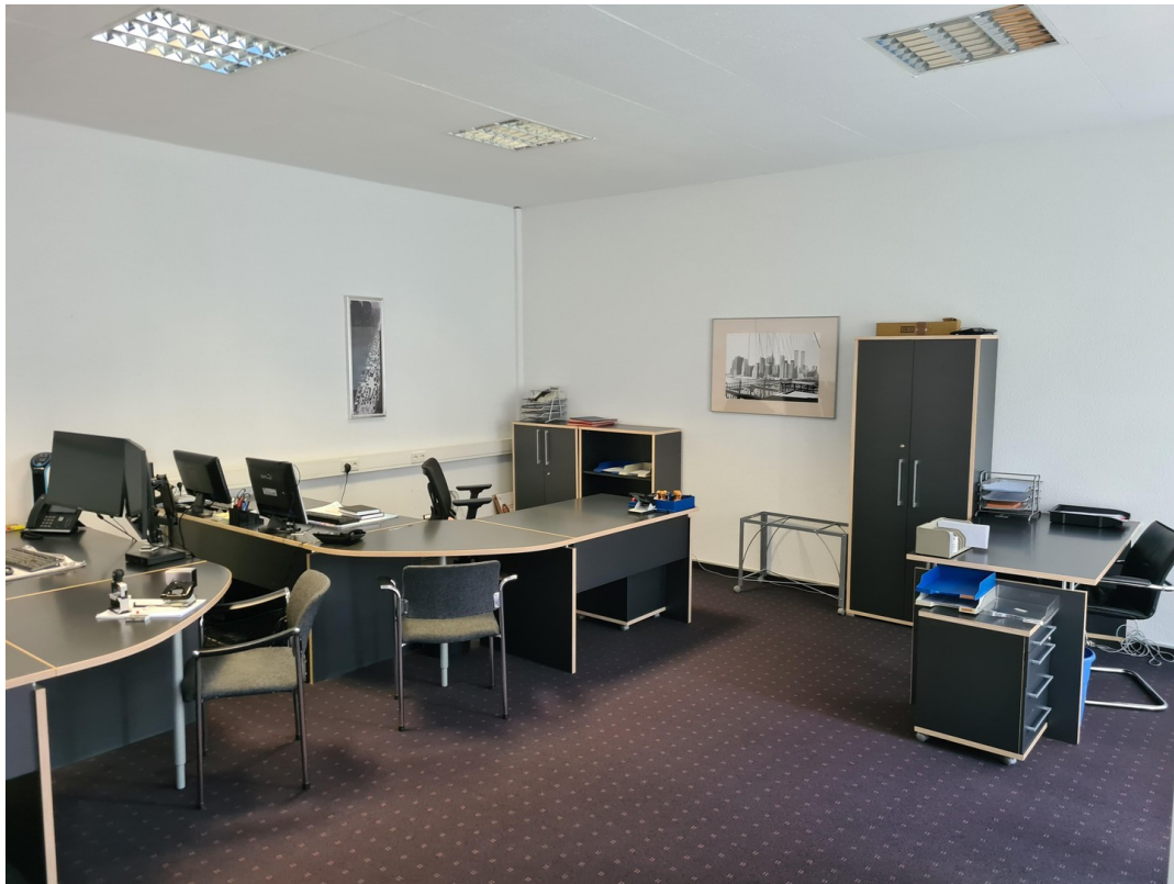
Gemeinschaftsbüro zur Strasse