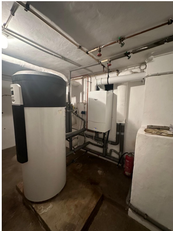
Heizung aus 2013