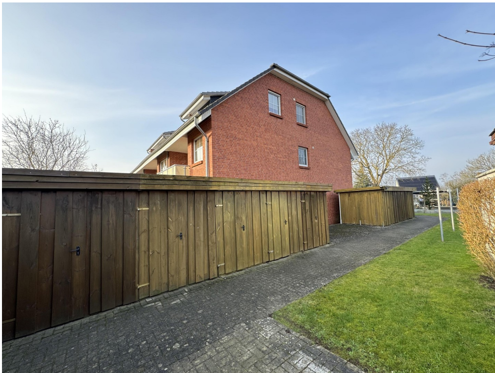
Außenansicht mit Schuppen