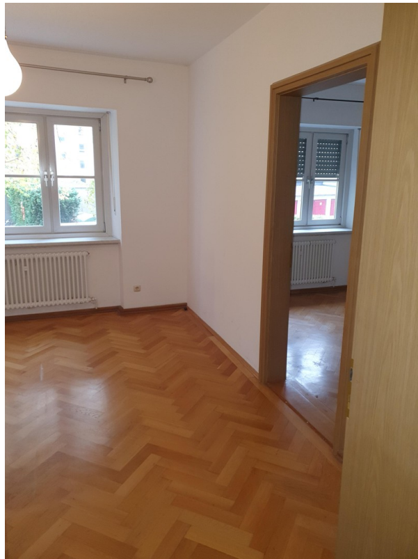
Durchgang zum Zimmer