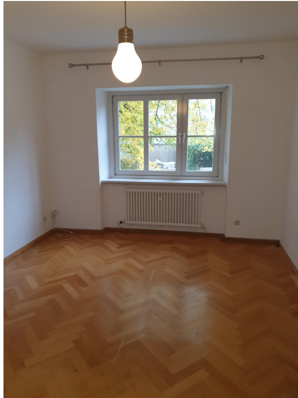
Zimmer mit Durchgang