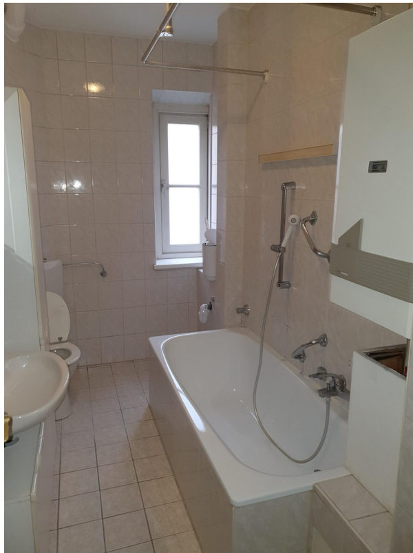
Badezimmer mit Wanne