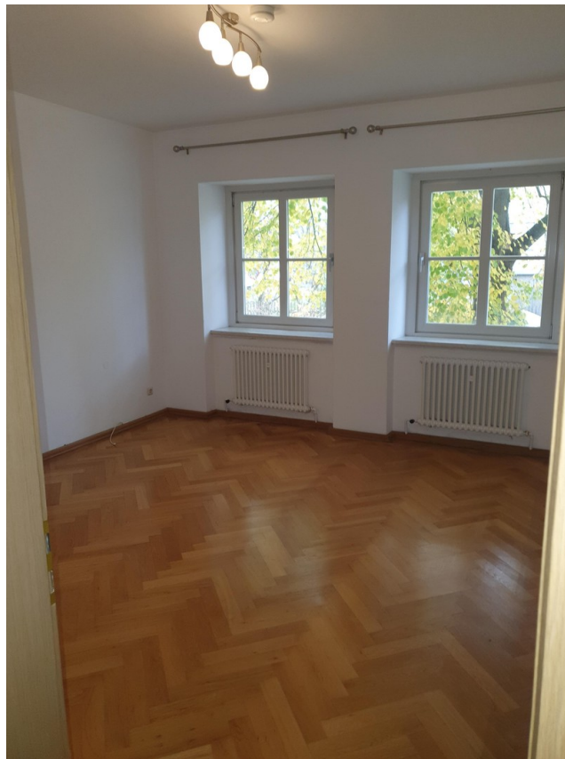
Zimmer ohne Durchgang