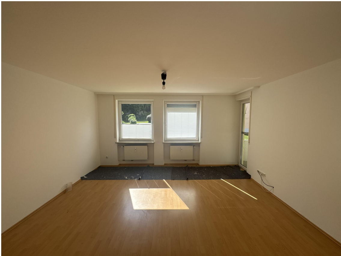
Zimmer mit Südbalkon (Bild 1)