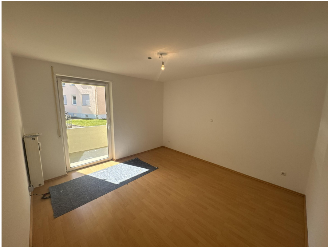
Mittleres Zimmer mit Südbalkon