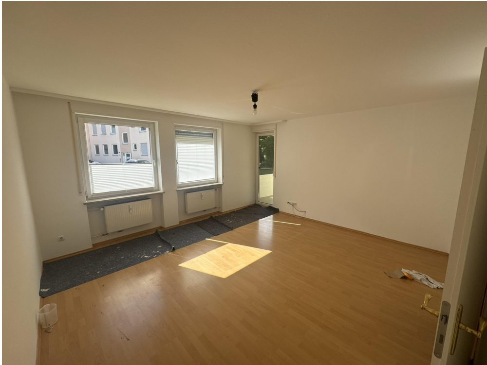
Zimmer mit Südbalkon (Bild 2)