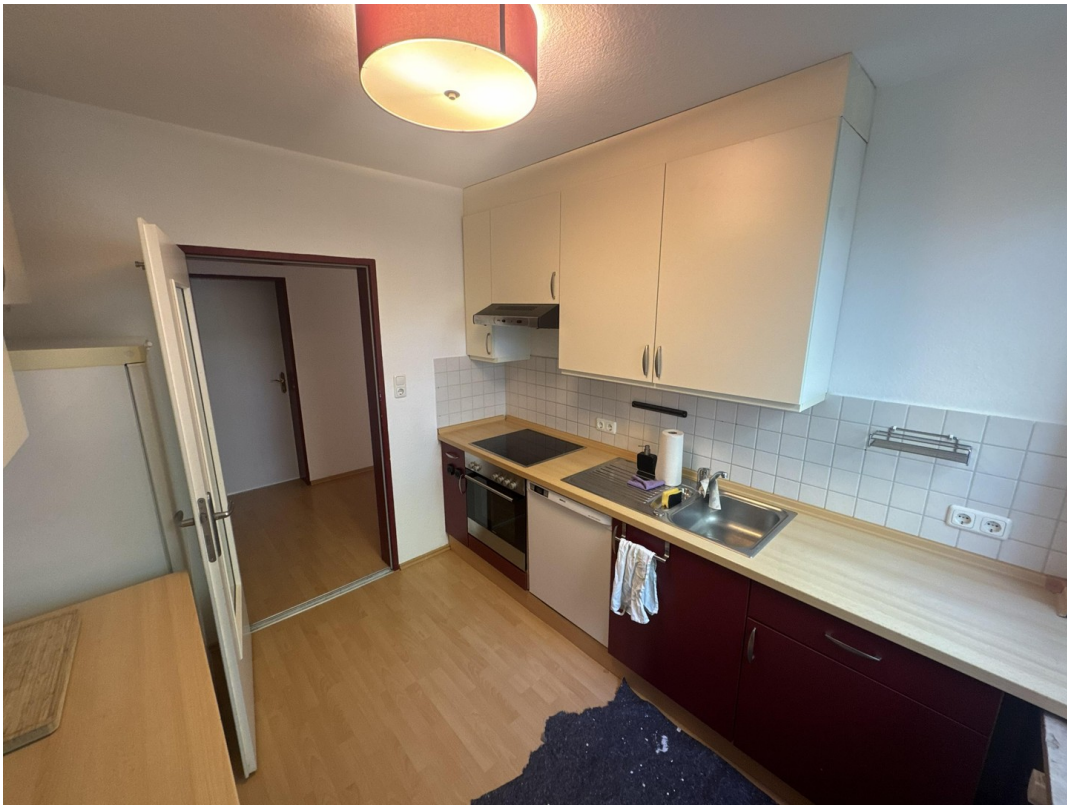
Küche (Bild 2)