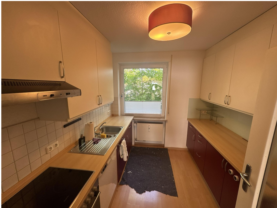
Küche (Bild 1)