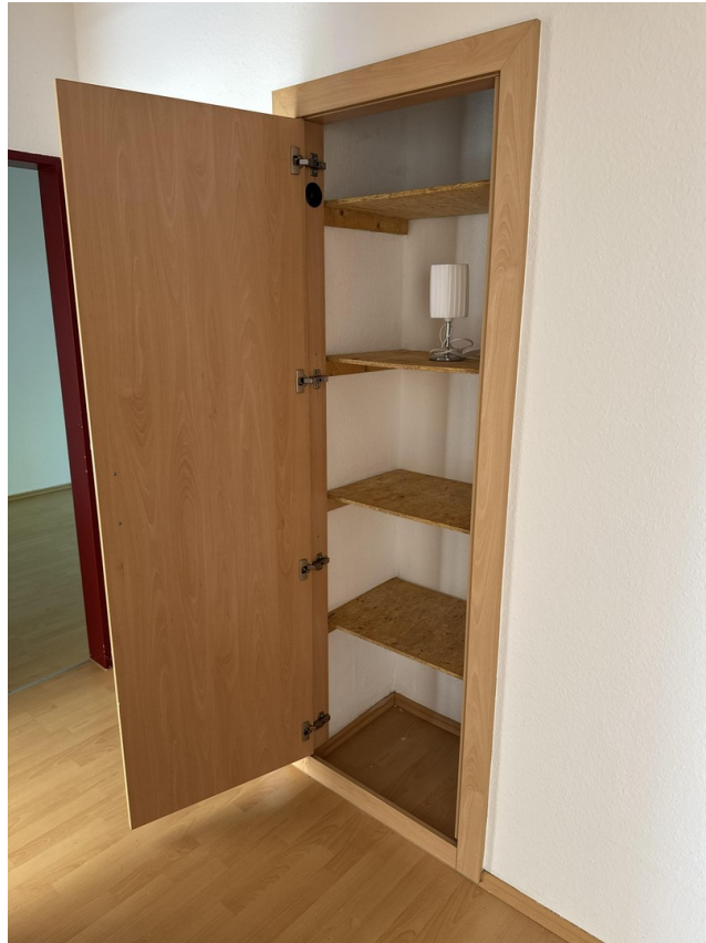
Kammer im Flur