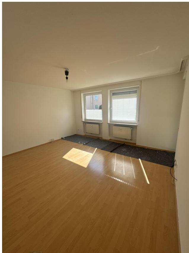
Zimmer mit Südbalkon (Bild 3)