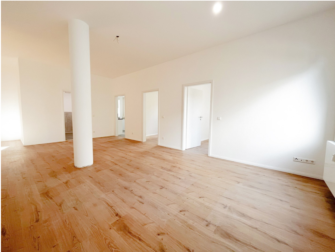
05 - Wohnen, Essen